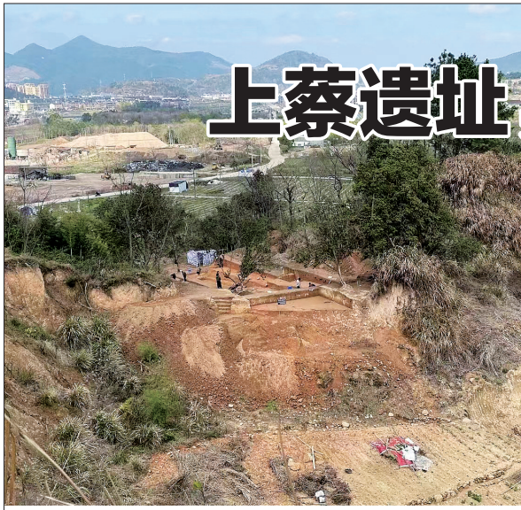
▲亭旁镇杨家村上蔡新石器考古遗址