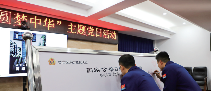
昨日是我国第九个“国家公祭日”,为深切缅怀南京大屠杀中的死难同胞,台州市消防救援支队黄岩大队组织开展悼念活动,号召全体队员勿忘国耻,铭记历史,坚定信念,砥砺前行。

截至目前,三门已完成“浙品码”赋码企业18家,涉及61个品类,赋码数853万。下一步,该县将继续探索“线上监管、用码监管”数字化监管模式,推动更多本地特色产业搭上“GM2D”的快车,逐步实现产业全覆盖。