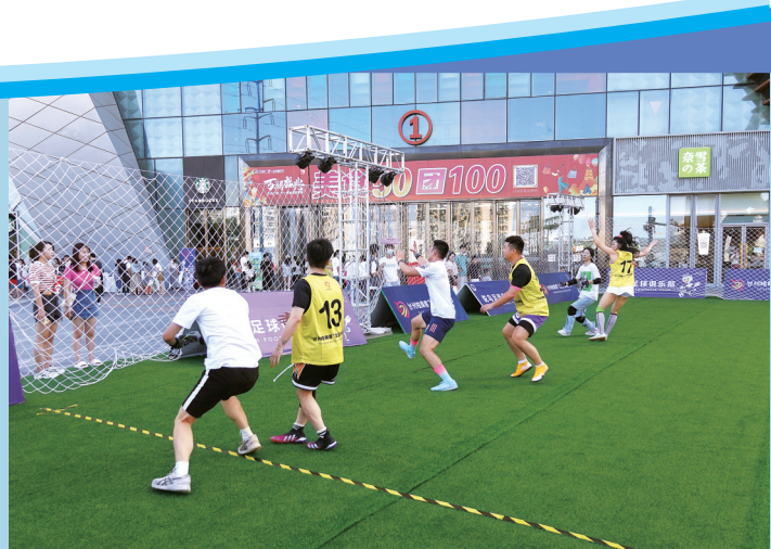
10月1日,椒江万达广场,飞盘比赛。