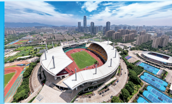
台州市体育中心航拍。