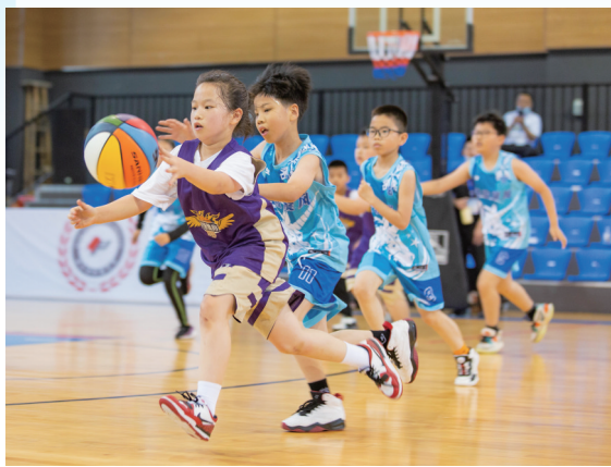
6月4日,在浙大台州研究院体育馆打篮球。