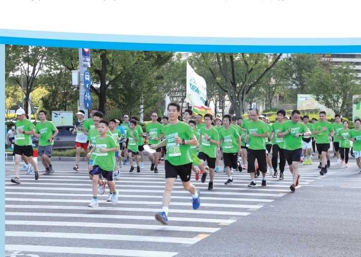
8月7日,椒江和合公园府中路,运动热情高。