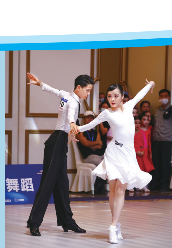
8月21日,拉丁舞比赛现场。