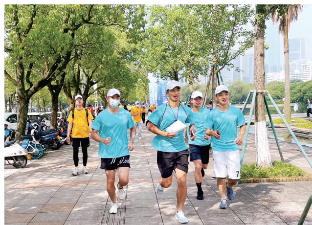
6月15日,台州市民广场,参加跑步活动。

椒江区文化和广电旅游体育局党组书记、局长金志良表示,椒江将秉承“更快、更高、更强”的体育精神,继续突出抓好重点项目和拳头项目,实现竞技体育高质量发展。下一步,椒江将在完善竞技体育治理体系上下功夫,向科技创新要成绩,树立科学引领训练的理念,不断提高训练质量和竞技水平。