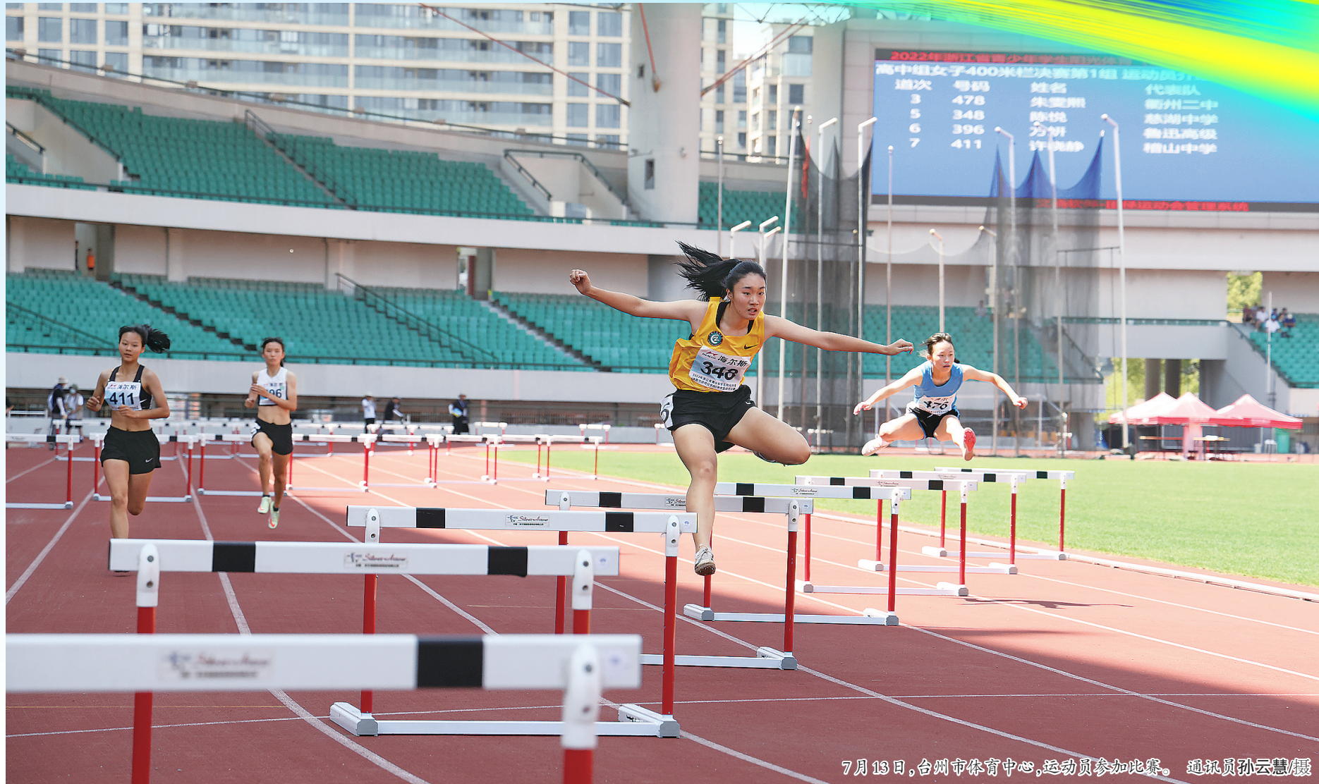
7月13日,台州市体育中心,运动员参加比赛。

“27.8金”背后,是椒江体育踔厉奋发、砥砺前行的不懈努力。过去四年,椒江区委、区政府紧抓省运会历史发展机遇,不断提升竞技体育水平,健全完善公共体育服务体系,体育产业带动社会效益增长,群众幸福感、获得感、满足感大大提高。