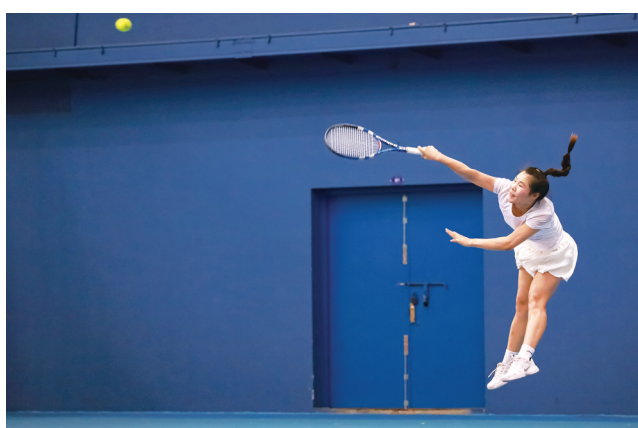
7月3日,在台州市体育中心网球场打球。