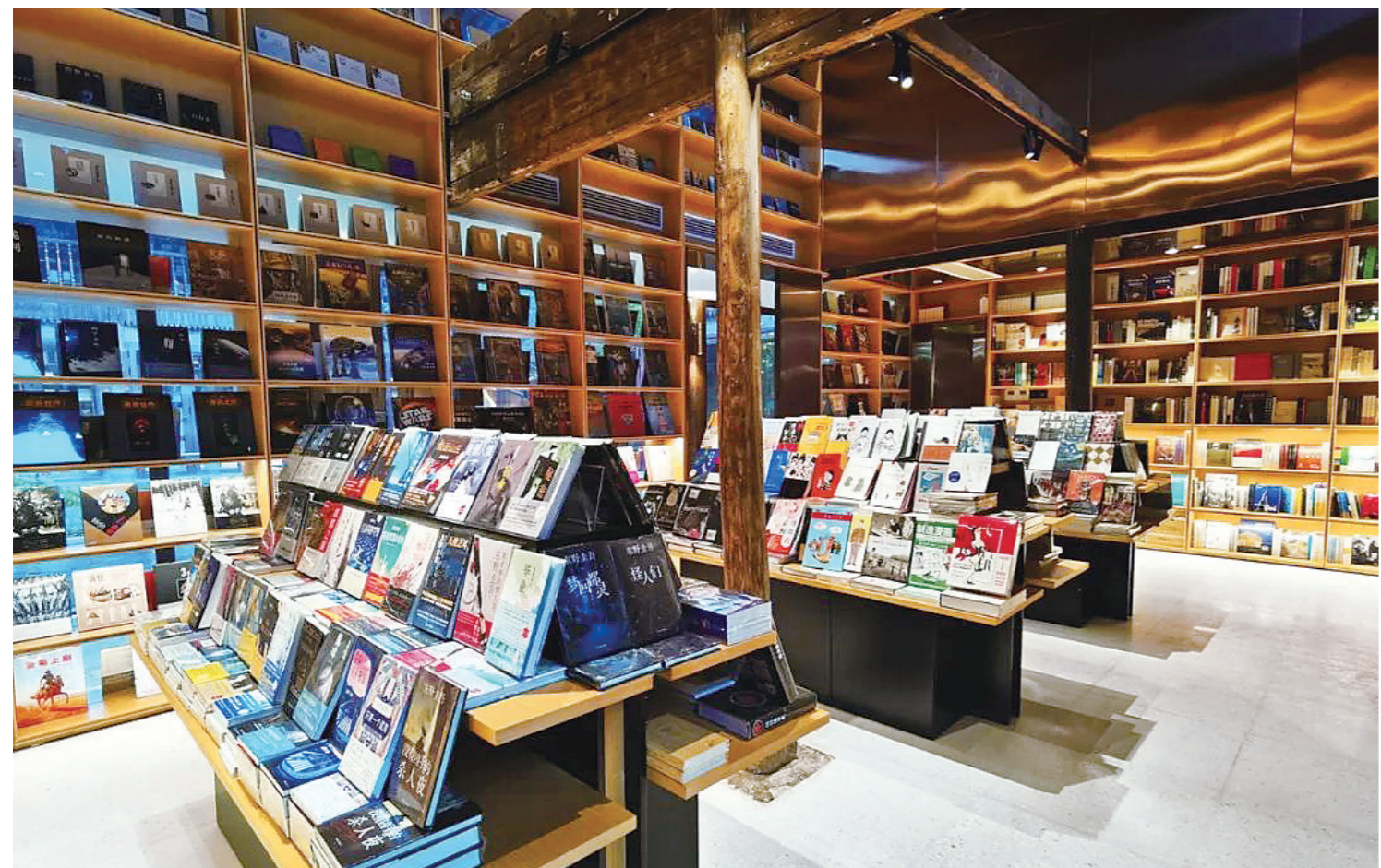
余丰里民宿书店