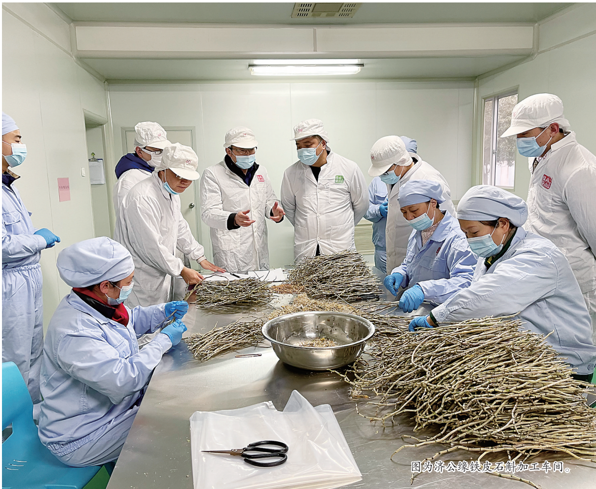
图为椒江公缘铁皮石斛加工车间。

除了资源丰富外,我市保健食品产业基础也十分雄厚。据了解,我市目前共有规模以上保健食品生产企业7家,其中天台4家,玉环2家,椒江1家,产值约为15亿元。虽然保健食品生产企业在数量上不占优势,但我市规上医药企业126家,其中上市医药企业19家,数量居全省第一,这些企业拥有保健食品研发技术、相关研究基础和研发条件,其中七成以上有进军保健食品行业的意愿,产业发展潜力巨大。