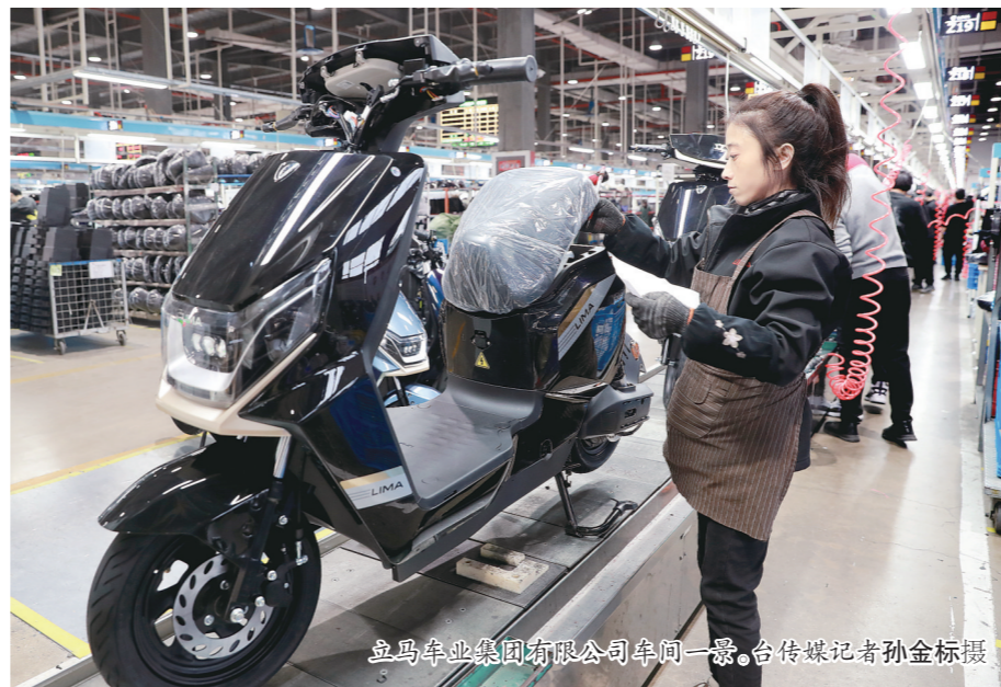
立马车业集团有限公司车间一景。

在春节使用的本地流量。同时,对持有台州公安机关签发的有效期内《浙江省居住证》且留台州过年的外来员工,给予流动人口积分奖励。