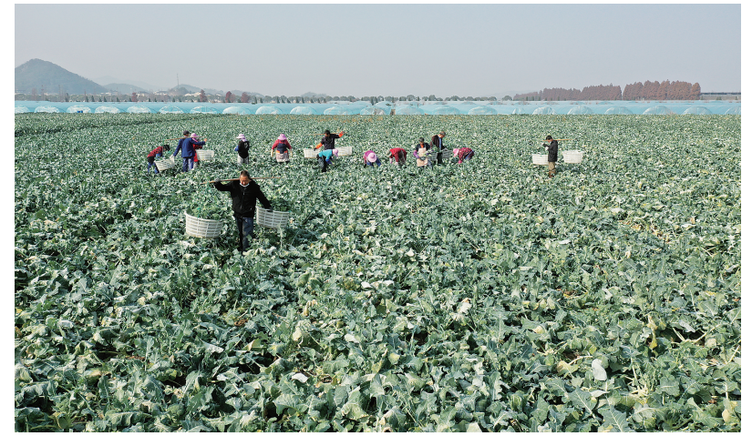
西蓝花产业助农增收

本次结对帮扶活动,共走访了联丰村10户贫困家庭。慰问组与他们拉家常,询问生产生活状况,了解和收集帮扶家庭遇到的困难和问题,与驻村干部和村干部探讨共富帮扶之策,为困难群众排忧解难。