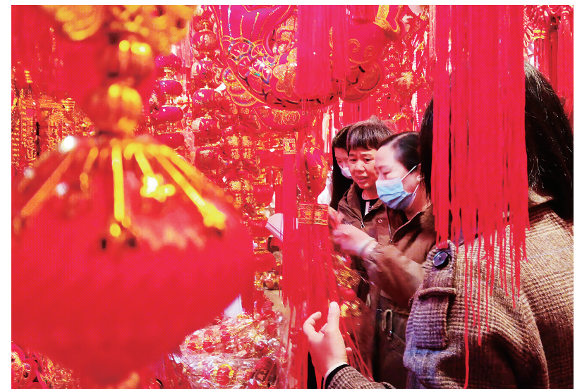
春节临近 新年饰品走俏

根据中国理财网数据统计,截至1月9日,在销售和存续的理财产品共10640只,其中,净值低于1的理财产品有1921只,较去年同期有所减少。理财收益回暖与近日股市、债市上涨相关,业内人士表示,A股元旦后波动上涨,上证指数突破3100点,债券市场则因政策转向宽松略有上浮,这对于权益类理财产品的收益上涨有明显的带动作用。