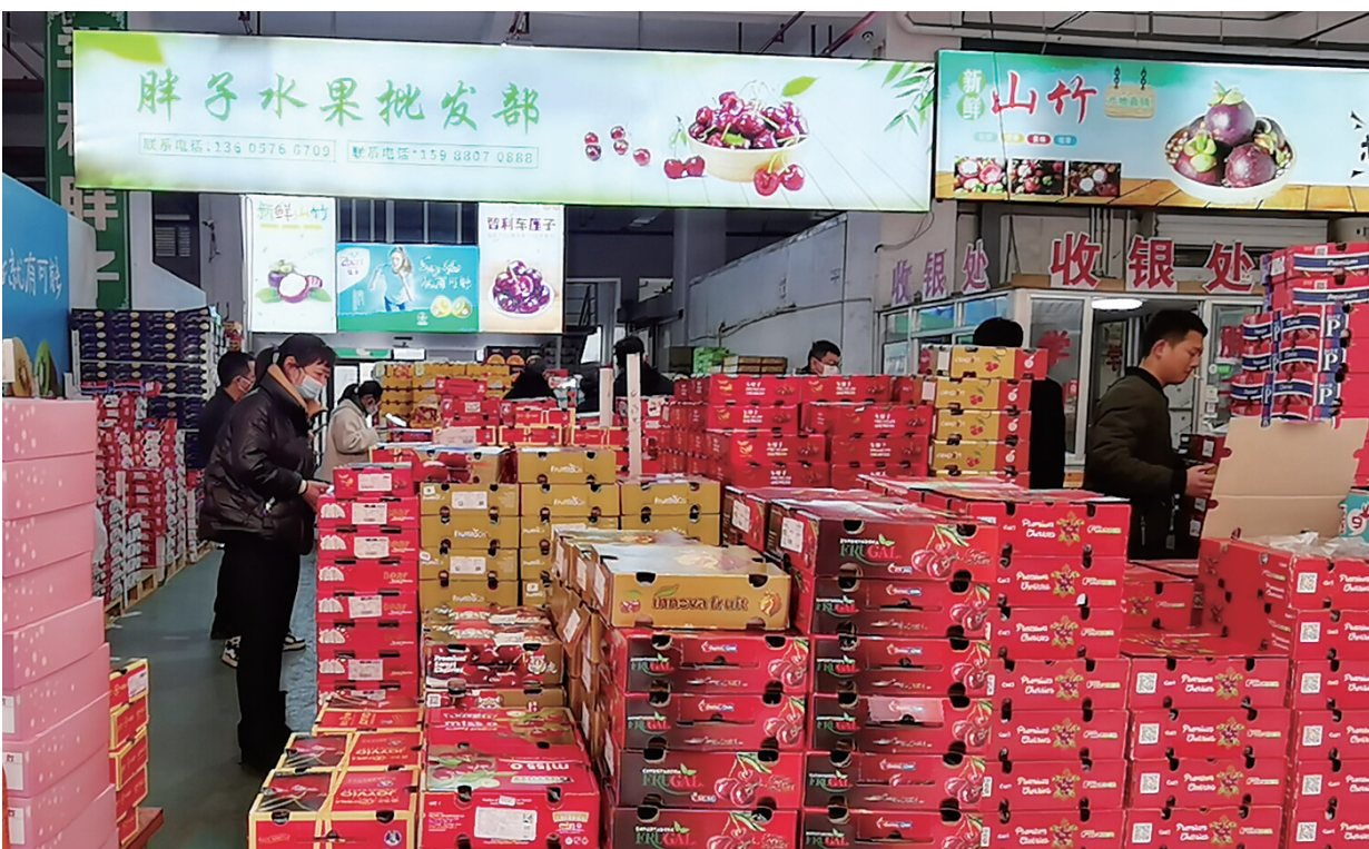
农港城水果区域采购车厘子的人络绎不绝。