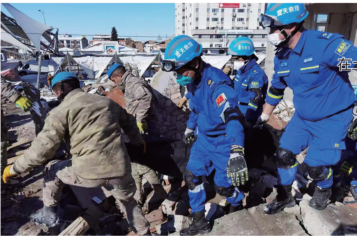
中国蓝天救援队在土耳其开展救援行动

中国体育博物馆与亚运会颇有渊源。1990年9月22日北京亚运会开幕,中国体育博物馆同日建成开馆。多年来博物馆一直致力于立足藏品讲述背后的故事,传播体育文化、弘扬体育精神、展现中国风貌。