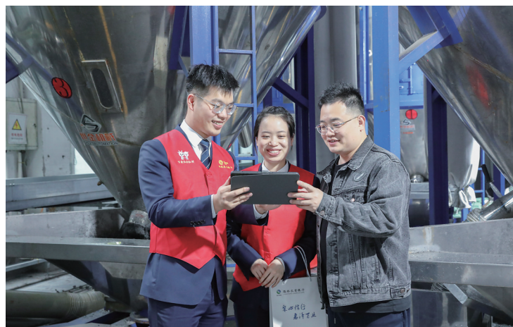
路桥农商银行客户经理开展送金融服务助企业发展。