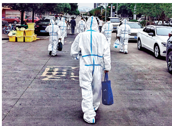
党员干部奋战在疫情防控第一线。