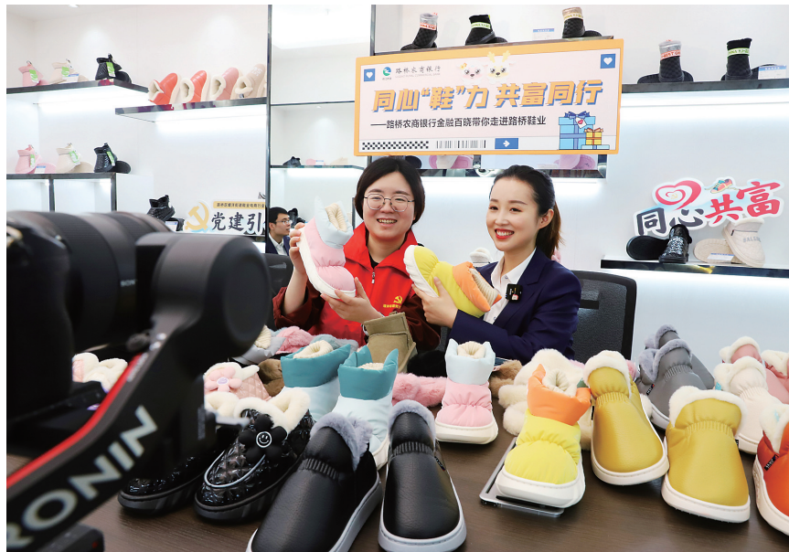
共富工坊为商家直播带货。