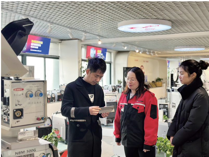
“百晓助百企”开展稳企助企活动。