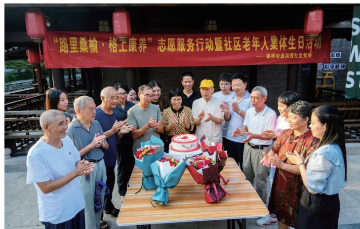
路桥街道河西社区老年人集体过生日。