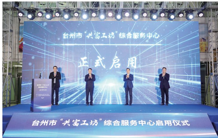
台州市“共富工坊”综合服务中心在路桥启用。

筑牢疫情防控“红色堡垒”,党员干部们下沉一线,争当科学防疫的先锋。去年以来,路桥区组建临时党支部307个、暖心服务小分队698支,发动党员干部2万余人下沉一线,助力打赢疫情防控阻击战。