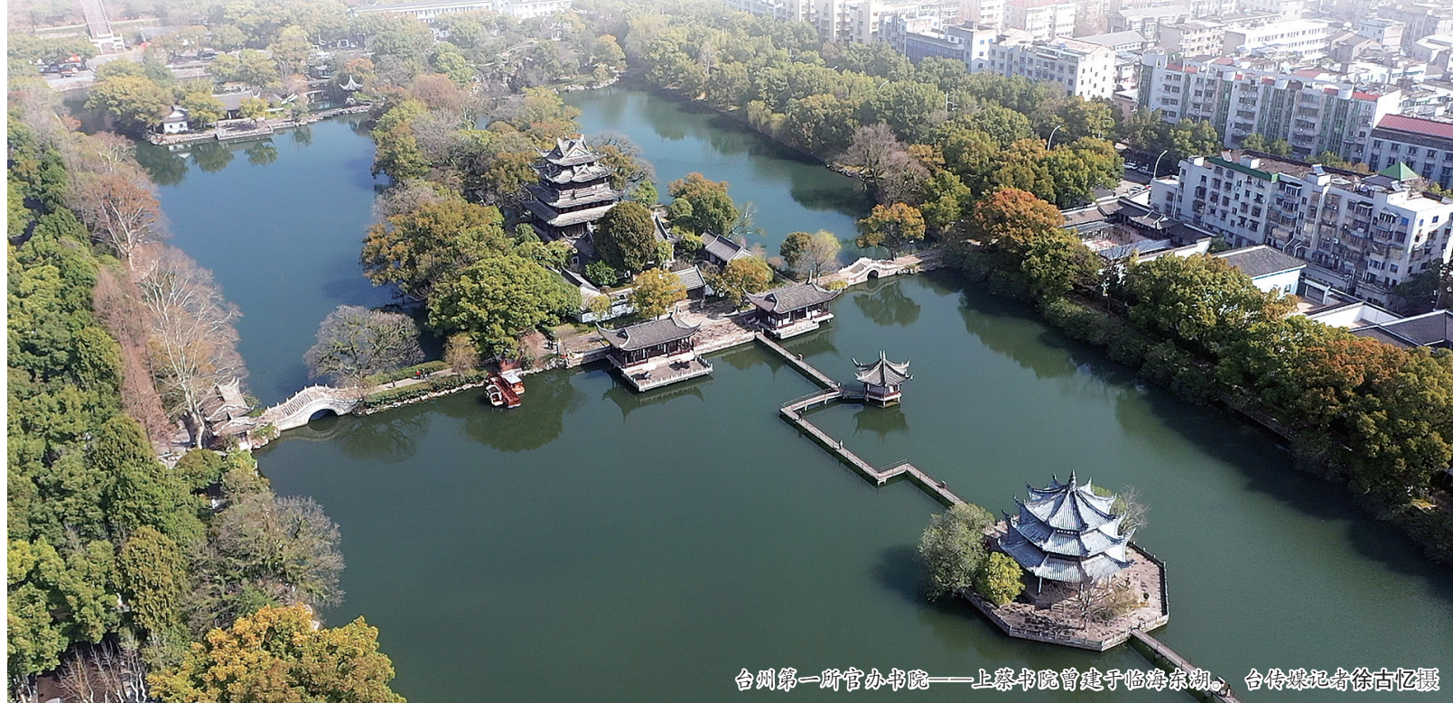
台州第一所官办书院——上蔡书院曾建于临海东湖。