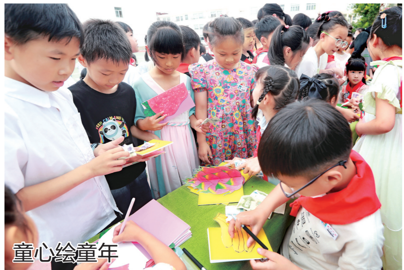
童心绘童年 5月31日,在路桥区横街镇中心小学的操场上,该校二年级20名小学生在售卖自己的绘画作品。六一儿童节来临之际,横街镇中心小学开展“童心童趣绘童年”活动,学生们通过阅读、劳动和绘画的形式,体验阅读的乐趣。

间救助力量在全国有一定知名度。 根据《温岭市渔船海上救助奖励办法》有关规定,经各渔业镇申报,相关部门审核,去年年底,温岭市港航口岸和渔业管理局对31个2020年-2022年度渔船海上救助先进单位进行奖励,共计奖励40.6万元,其中石塘镇25.3万元,松门镇13.3万元,城南镇2万元。 5月30日,《浙东经济合作区渔船互救奖励资金管理暂行办法》正式实施。奖励标准提高到:成功救起落水渔民的,每救起一人奖励1.5万元,每起事故奖励金额最高不超过8万元;未成功救起落水人员的,每打捞出1人给予5000元奖励,每起事故奖励金额最高不超过5万元。 在救助情况发生后,参加救助渔船所属单位或船舶所有人可向所属县(市、区)渔业主管部门申请奖励。