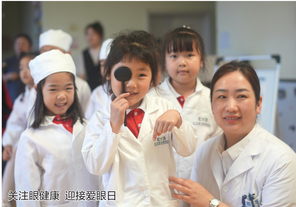
关注眼健康 迎接爱眼日