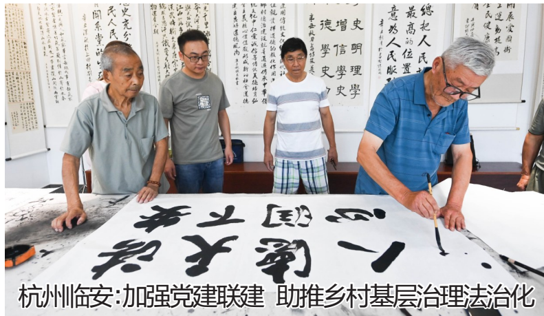
杭州临安:加强党建联建 助推乡村基层治理法治化

7月13日,在杭州市临安区板桥镇上田村文化礼堂,书法爱好者书写用于法治宣传教育的书法作品。