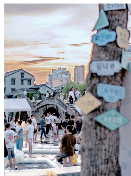
7月初,黄岩举办散步文化节,启动活动是一场专属于散步爱好者的“黄岩Citywalk | 傍晚去五洞桥”活动。

“接下来,我们会花两个月的时间,深入走访这十条路。市民也可以报名和我们一起走街串巷,发掘每条路的日常往事以及传奇故事。最后我们会以刊物的形式呈现给大家。”小鱼说。