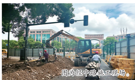
图为经中路段施工现场。