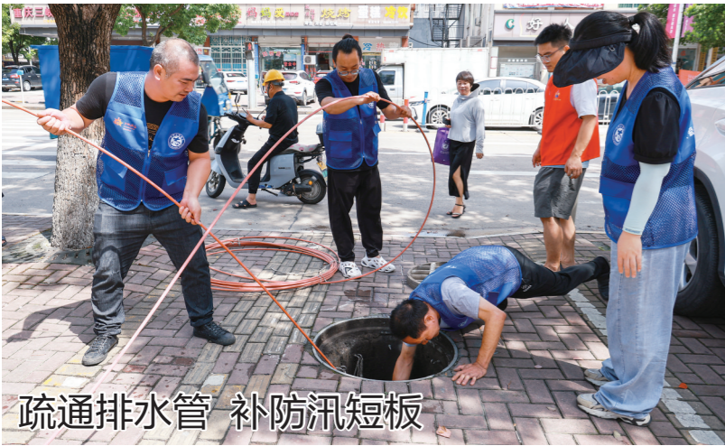
疏通排水管 补防汛短板

方溪河道清障工作,各山塘水库保持水位在限水位以下;盘点补足应急物资,保障供应,并做好应急队伍集结,随时应召出动。