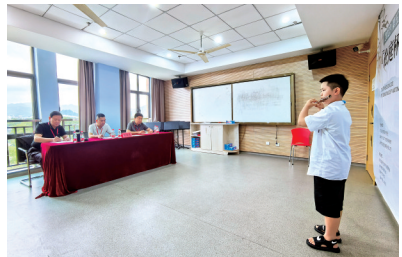
第五届“松庭杯”全国笛箫邀请赛比赛现场。