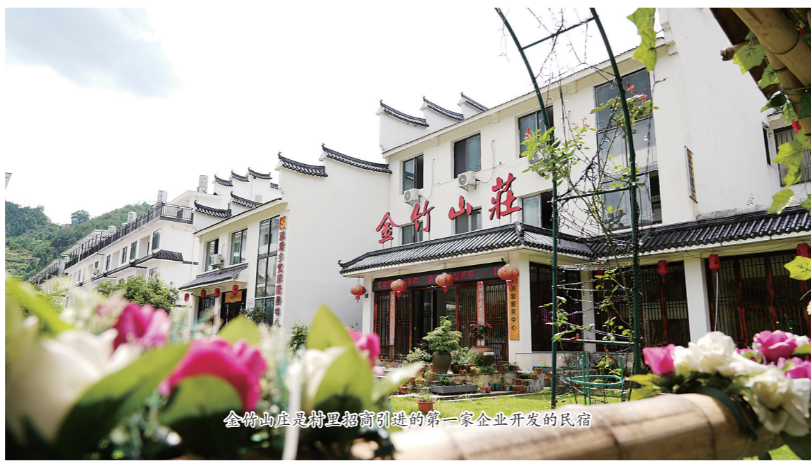
金竹山庄是村里招商引资的第一家企业开发的民宿

一张蓝图绘到底。未来，如何进一步提质增效，村集体的角色如何再定位？我想，村两委干部应进一步规范民宿管理、提升经营管理水平、提高服务质量、增强标准化意识，把品质提上去的同时，探索建设农产品展示展销馆等，让乡村旅游功能进一步拓展。