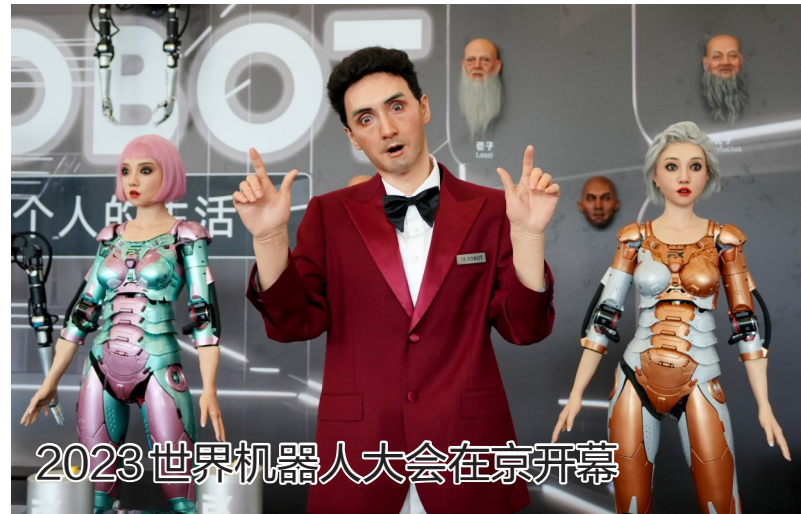
2023世界机器人大会在京开幕

8月16日,仿生人形机器人在进行表演。当日,2023世界机器人大会在北京开幕,本次大会的主题为“开放创新 聚享未来”,包含论坛、博览会、机器人大赛等活动。