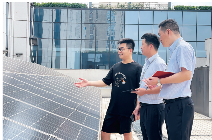
民泰银行路桥支行客户经理实地考察路桥区整区分布式光伏发电项目。

截至今年6月末,该行各类绿色信贷余额55.51亿元,较年初增加5.24亿元,增幅10.42%,服务企业超900户。