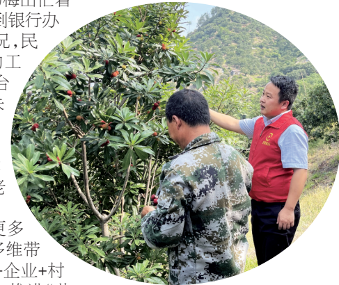
民泰银行白水洋支行客户经理上门为杨梅种植户提供服务。

截至目前,台州市已建成来料加工式、定向招工式、电商直播式、农旅融合式、品牌带动式、产业赋能式等六类“共富工坊”1300多家。结合台州地域特色,民泰银行深化推进伙伴银行机制,重点加大“共富工坊”的金融支持力度,积极推广“批量授信”模式,切实做好普惠金融服务。