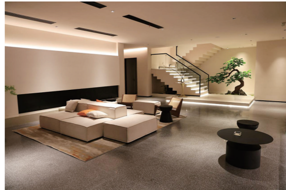
喔里民宿开辟不同区块供游客休息。