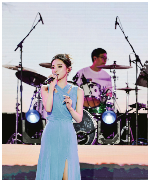
东二九乐团“城市湖畔Live Show—音乐韶华”2023流行经典专场音乐会演出现场。采访对象供图