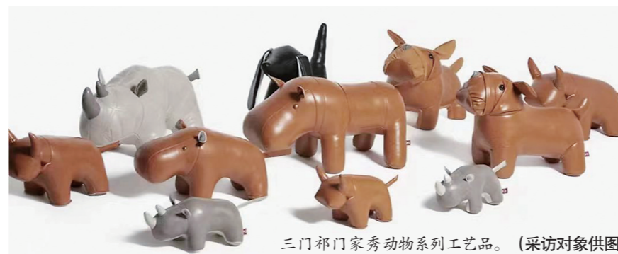
三门祁门家秀动物系列工艺品。

近年来,台州深挖文化资源,加强旅游商品研发,鼓励各类文化创意企业、非遗传承人等开展文创产品设计,开发培育形成一批台州印记文创伴手礼,充分展示了台州文创的强劲实力。