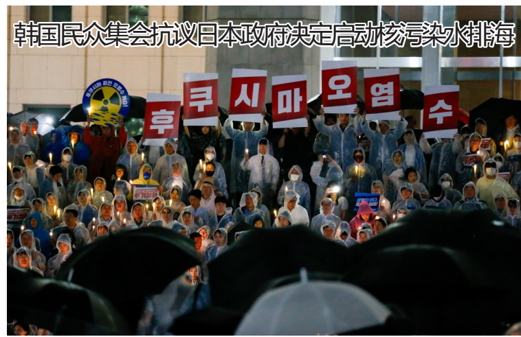
8月23日,在韩国首尔的国会议事堂前,韩国最大在野党共同民主党举行集会抗议日本政府决定启动核污染水排海。