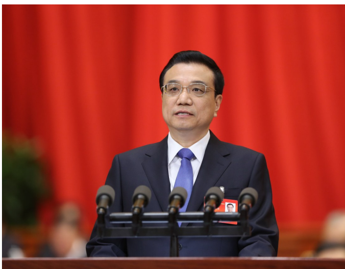
2014年3月5日,第十二届全国人民代表大会第二次会议在北京人民大会堂开幕,李克强同志作政府工作报告。

中国共产党的优秀党员,久经考验的忠诚的共产主义战士,杰出的无产阶级革命家、政治家、党和国家的卓越领导人,中国共产党第十七届、十八届、十九届中央政治局常委,国务院原总理李克强同志,因突发心脏病,经全力抢救无效,于2023年10月27日0时10分在上海逝世,享年68岁。