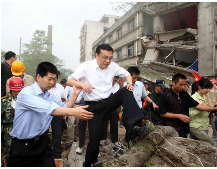
2008年5月19日,李克强同志在四川地震灾区察看灾情。