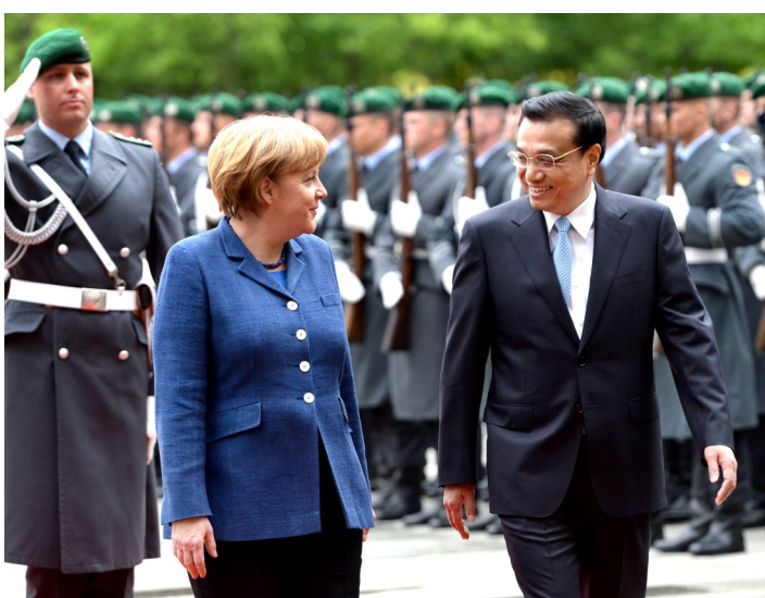
2013年5月26日,李克强同志在柏林出席德国总理默克尔举行的欢迎仪式。