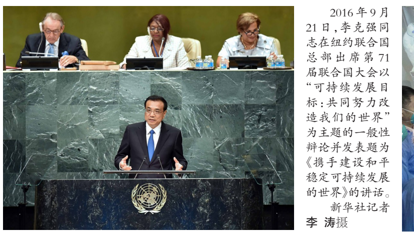
2016年9月21日,李克强同志在纽约联合国总部出席第71届联合国大会以“可持续发展目标:共同努力改造我们的世界”为主题的一般性辩论并发表题为《携手建设和平稳定可持续发展的世界》的讲话。