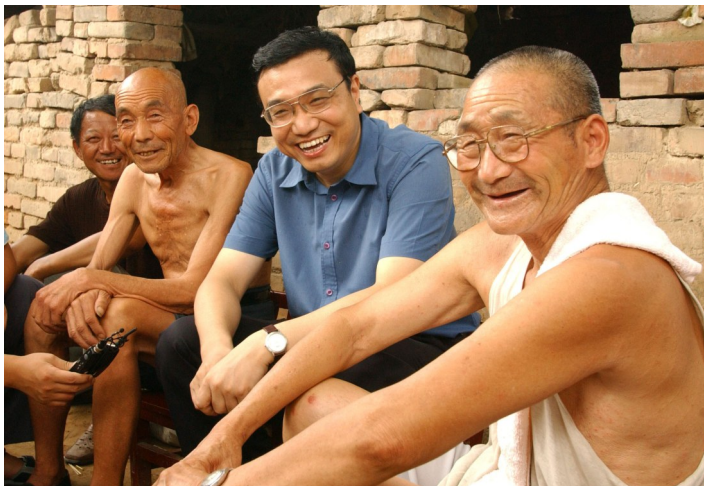
2003年8月8日,李克强同志在河南省新乡市调研。这是李克强同志在原阳县北乡马庄村与村民亲切交谈。