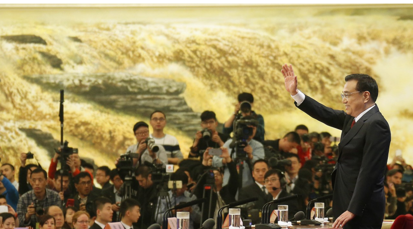
▲2016年3月16日,李克强同志在北京人民大会堂与中外记者见面,并回答记者提问。