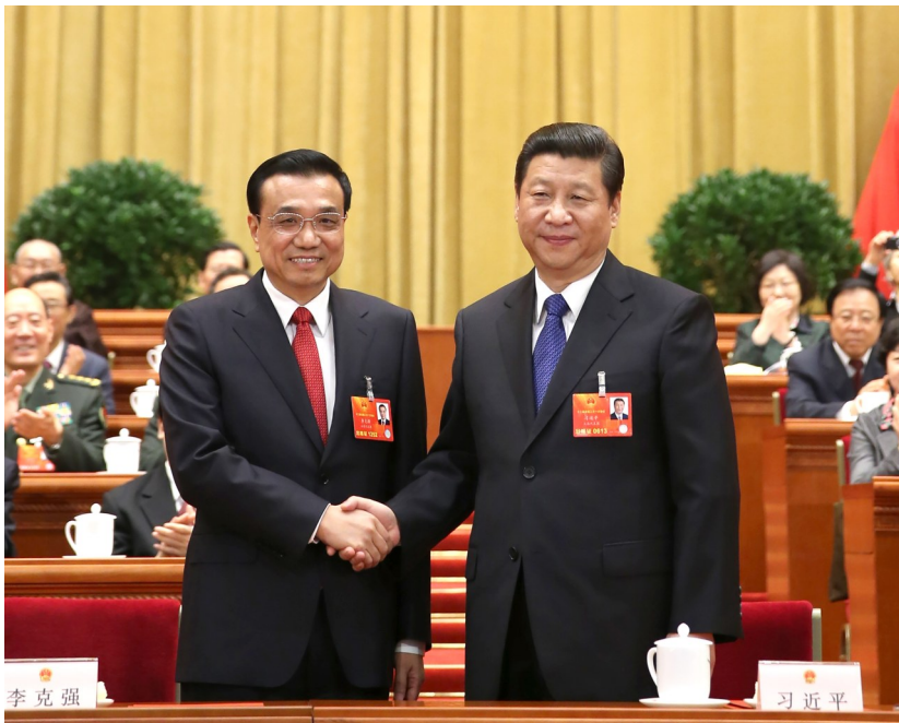
2013年3月15日,第十二届全国人民代表大会第一次会议在北京人民大会堂举行第五次全体会议。会议经过投票表决,决定李克强为中华人民共和国国务院总理。这是习近平同志和李克强同志亲切握手。