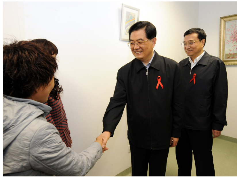
2008年12月1日是第21个世界艾滋病日。胡锦涛同志和李克强同志来到北京地坛医院考察艾滋病防治工作。