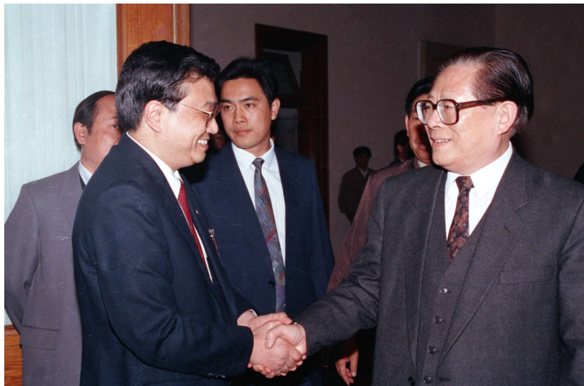
1993年5月3日下午,中国共产主义青年团第十三次全国代表大会在北京人民大会堂开幕。在5月3日上午的预备会议上,举行第一次主席团会议,推选李克强等同志为主席团常务主席。这是江泽民同志与李克强同志握手。