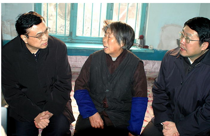
2004年12月26日,李克强同志到宁夏省吴忠市青铜峡市居民王淑贞家中走访调研。