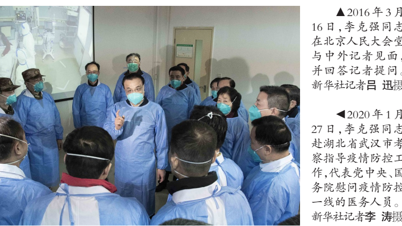
▲2020年1月27日,李克强同志赴湖北省武汉市考察指导疫情防控工作,代表党中央、国务院慰问疫情防控一线的医务人员。