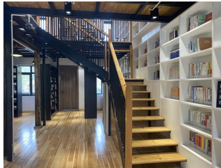
黄岩区屿头乡村振兴学院和合书吧。