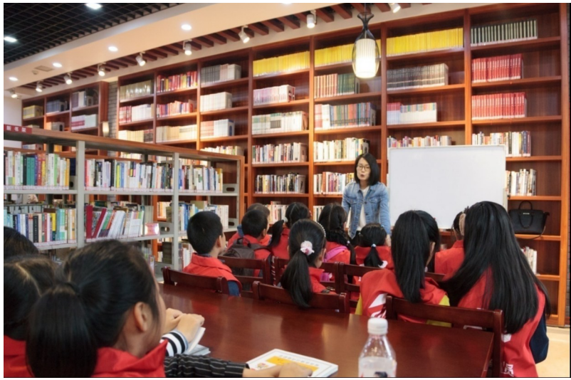
体育场路和合书吧正在举办讲座。