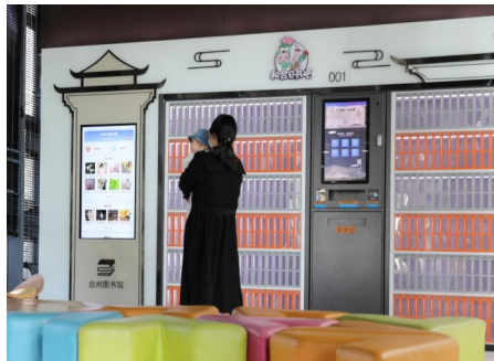
台州市妇女儿童医院和合e书吧“001号”。

未来,台州市图书馆将对和合e书吧继续升级扩容,深化数据开放和资源共享,不断完善服务功能,打造特色阅读模块,完成阅读空间从“1”到“∞”的转变,给读者带来更多新奇的阅读体验。