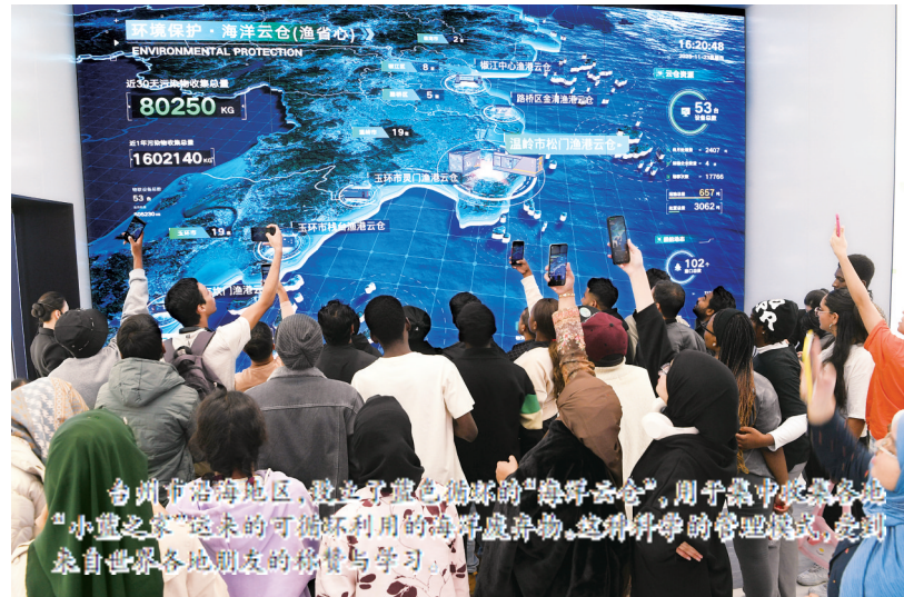
台州市海洋云仓(渔管中心),展示了台州在海洋保护和环境治理方面所取得的成就。这个云仓将被用于储存和处理从海洋中捡拾的可循环利用的废弃物。来自世界各地的朋友的热情与学习。