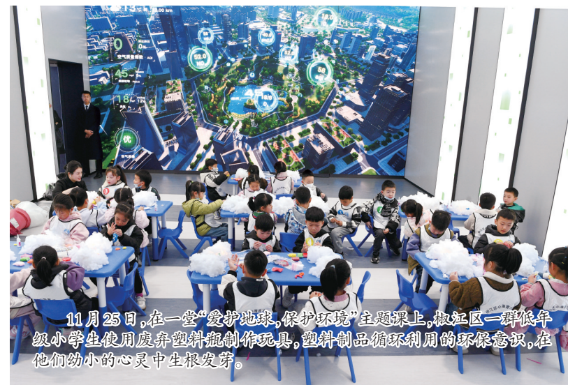
11月25日,在“爱护地球,保护环境”主题课上,椒江区一群低年级小学生使用废弃塑料瓶制作玩具,塑料制品循环利用的环保意识,在他们幼小的心灵中生根发芽。