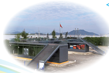
位于椒江门外沙的台州海洋云仓(渔管中心),展示了台州在海洋保护和环境治理方面所取得的成就。这个云仓将被用于储存和处理从海洋中捡拾的可循环利用的废弃物。