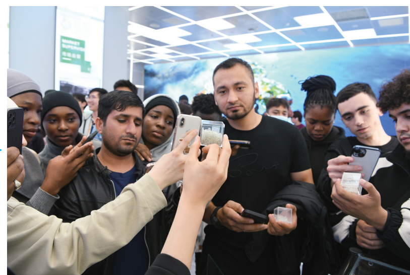
11月23日,在台州“城市大脑”运营中心(数字馆),工作人员向来自世界各大洋沿岸的留学生们展示了再生塑料颗粒。这些颗粒,由台州沿海群众捡拾的海洋废弃塑料制造而成。工作人员说,“扫描二维码,就可以了解这些再生塑料来自海边的哪个位置。”