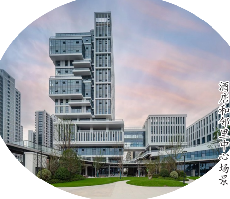
酒店希铂里中心场景