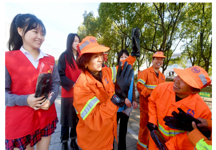
受强寒潮影响,近期气温骤降。日前,路桥区路北街道党员志愿者和专职网格员在街路上作业的环卫工人送上防寒用品。台州传媒通讯员王保初摄

为营造浓厚的廉洁文化氛围,沙柳派出所坚持“以文化人、以廉养德”,打造“清和”屏风、“点亮”读书角、所史馆、廉茶室和清廉阳台等,让民警辅警抬头可见、驻足可观,在潜移默化中以廉洁清风浸润警心。