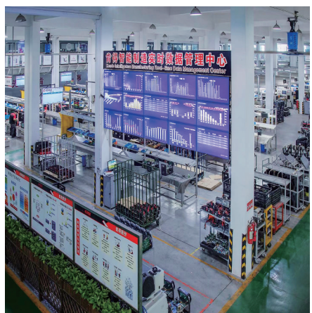
路桥区经信局数智赋能“优选优育”,推动规上企业数字化改造覆盖率超93%。