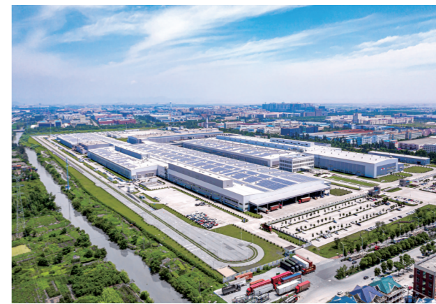
&gt;&gt;&gt;沃尔沃汽车台州工厂

一个个招商引资项目的签约落地,蕴含着一个个发展机遇。这是全开发区上下“拼”“抢”“干”出来的招商实践,也是一场共享机遇、互利共赢的“双向奔赴”。