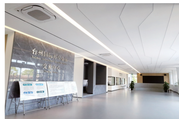
&gt;&gt;&gt;台州国际再生金属交易中心

一个个项目是催人奋进的战鼓,一排排厂房是动能转换的引擎。随着各项规划措施逐步落地,更多美好愿景变成生动场景,在路桥经开区这片土地上,将会呈现出更多美好新图景、发展新机遇、澎湃新动能。