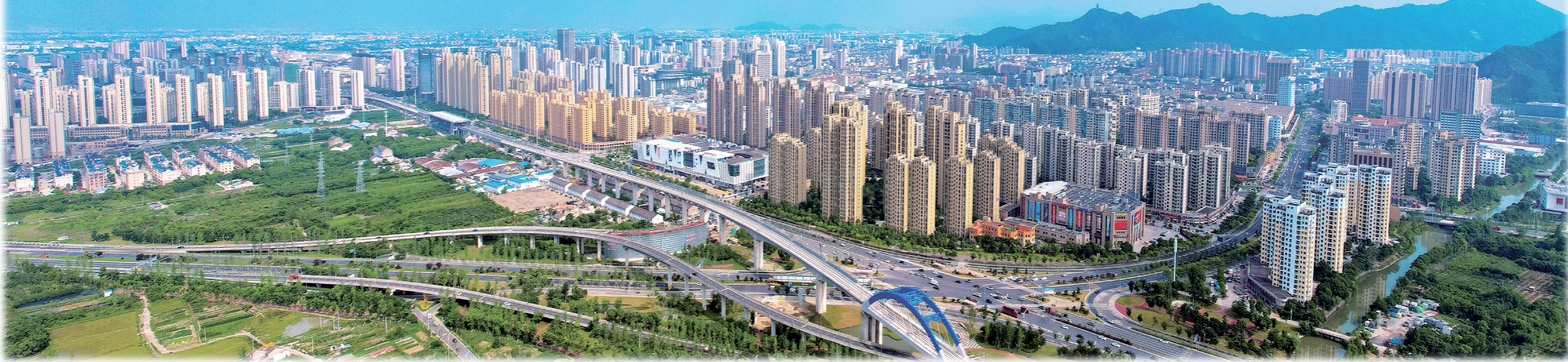
&gt;&gt;&gt;路桥经开区城市风光图