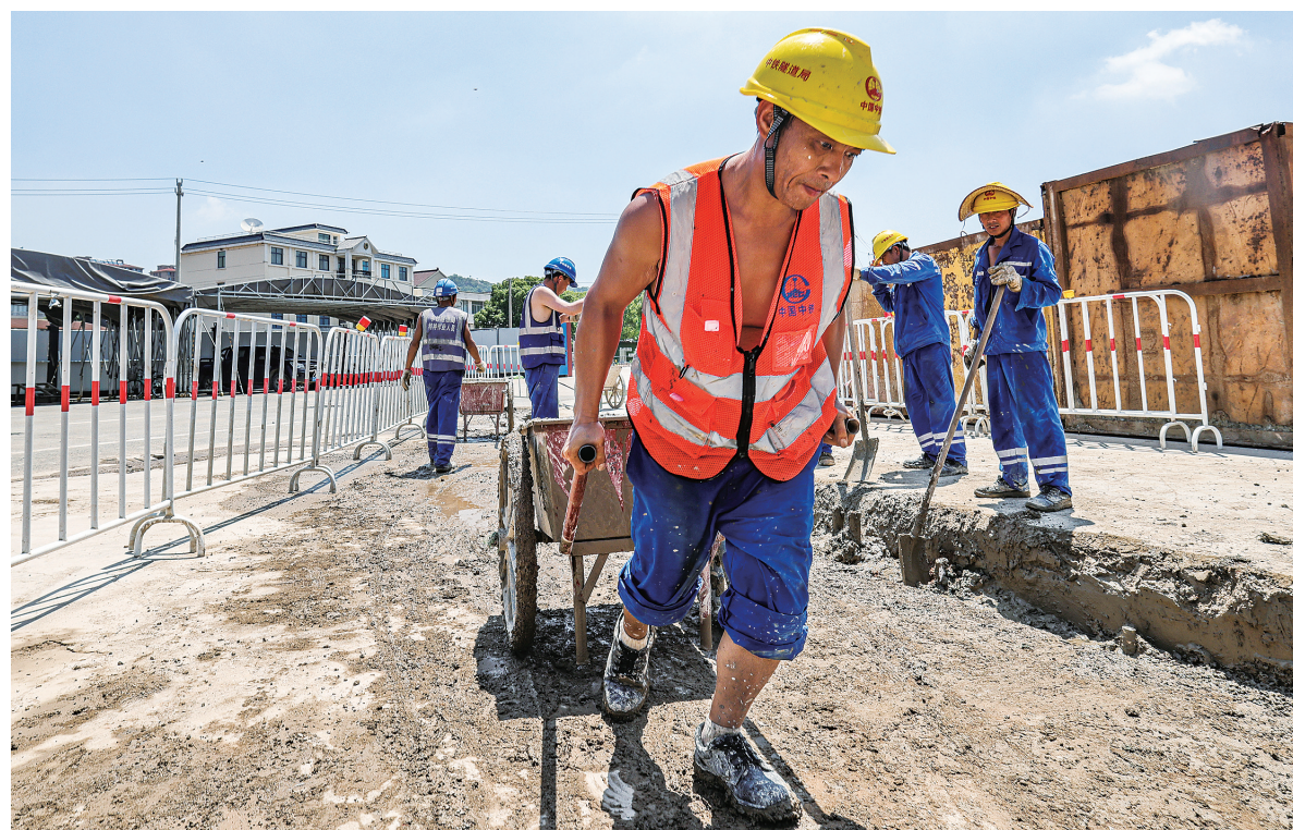
7月3日,解放路过江隧道江北始发段项目工地的建设场景。