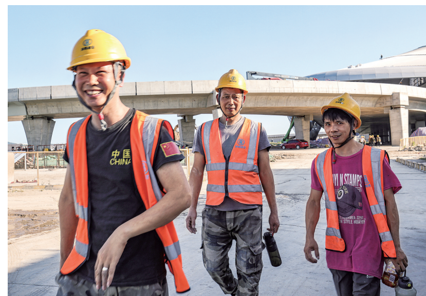
7月3日,台州机场改扩建项目工地,收工的工人。