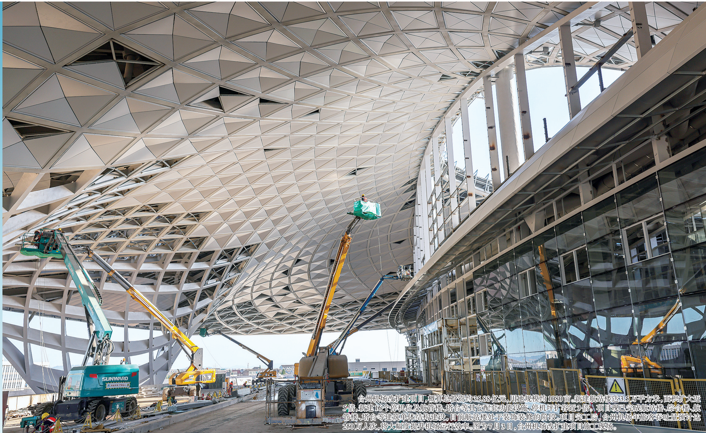
台州机场改扩建项目,概算总投资约35.88亿元,用地规模约1080亩,新建航站楼达35万平方米,面积扩大近5倍,新建16个停机位及航管楼、塔台等其他配套功能设施,停机坪容量近3倍。项目现已完成航站楼、综合楼、航管楼、塔台等建筑主体结构建设,目前航站楼处于装饰装修的阶段。项目完工后,台州机场年旅客吞吐量预计达250万人次,将大幅度提升机场运行效率。图为7月3日,台州机场改扩建项目施工现场。