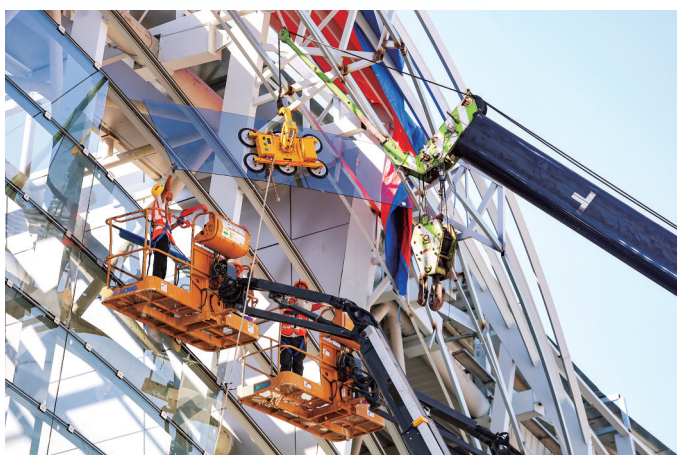
台州国际博览中心项目总投资约51.67亿元,占地约320亩,总建筑面积约42.2万平方米,规划建设集展览、会议、办公、酒店、商业等功能为一体的大型会展综合体。其中,一期项目由2-7号展厅组成,预计9月,国博中心将举办首展。图为7月3日,国博中心一期施工现场,工人们在安装玻璃。