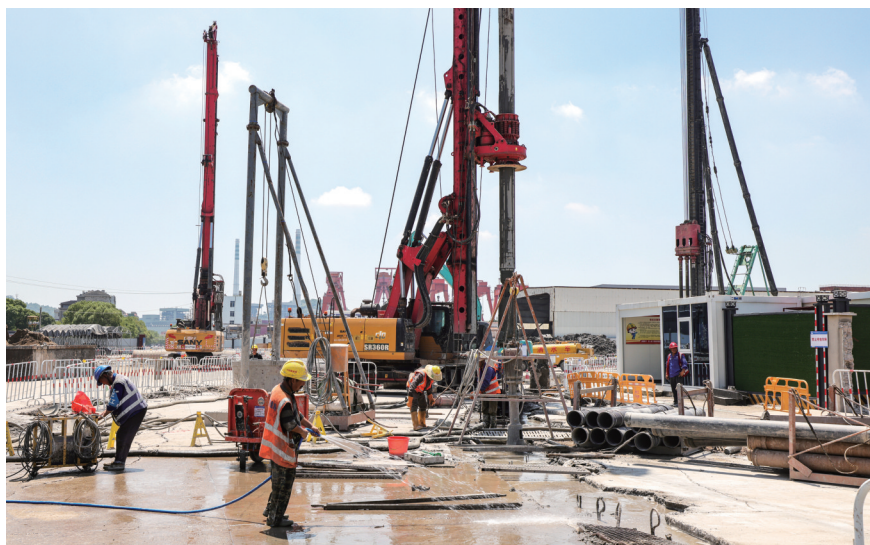
解放路过江隧道及南接线工程是一江两岸城市空间发展部署规划的重要节点工程,作为台州建设的第一条过江隧道,项目总投资逾40亿元,北起章安大道与大路线交叉口南侧,南至青年路南侧,主线全长4220米,其中江底盾构隧道长1822米。建成后,椒江南北两岸的通行时间将缩短为5分钟。图为7月3日,解放路过江隧道江北始发段项目工地。