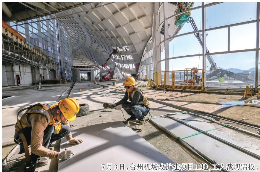
7月3日,台州机场改扩建项目工地,工人裁切铝板。