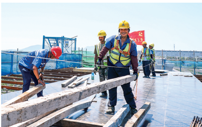
台州市域铁路S2线是台州市东西向的重要联系通道,项目建成后将与市域铁路S1线共同组成中心城区“东进西扩、南联北跨”的台州城市轨道交通骨干网络,对推动“三区两市”融合、完善城市综合交通体系、改善居民出行条件具有重要意义。图为7月3日,S2线7标段工地上,工人们在铺装木板。