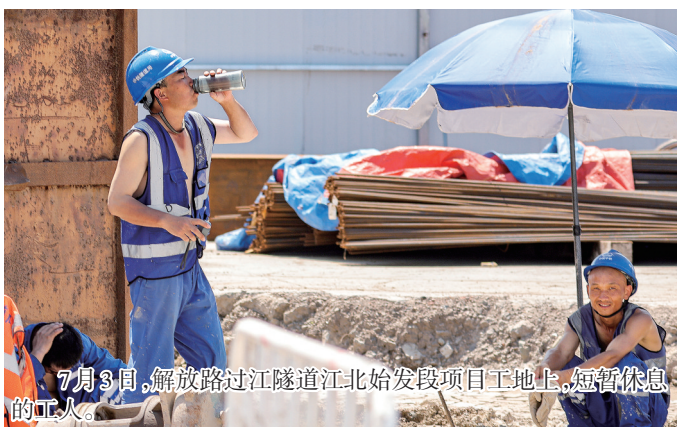
7月3日,解放路过江隧道江北始发段项目工地上,短暂休息的工人。