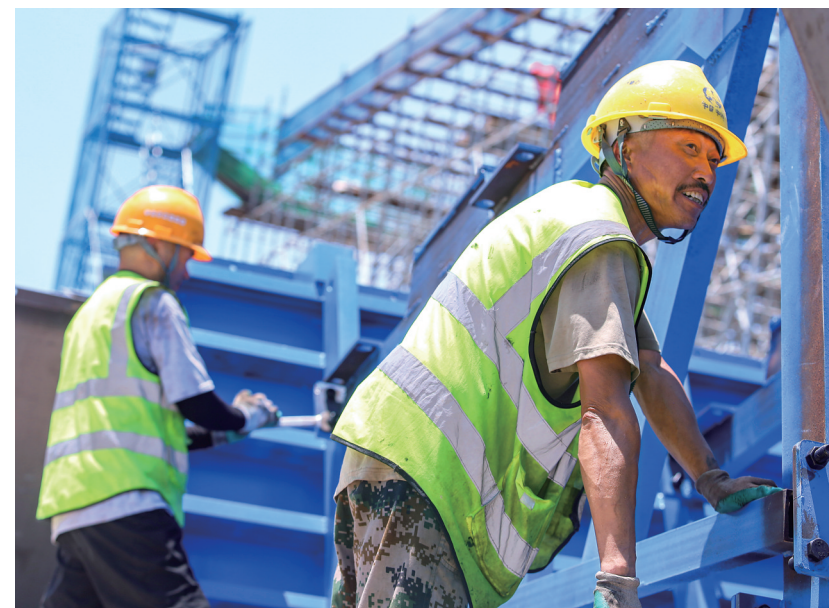
7月3日,台州市域铁路S2线7标段工地上,工人们在组装边膜。