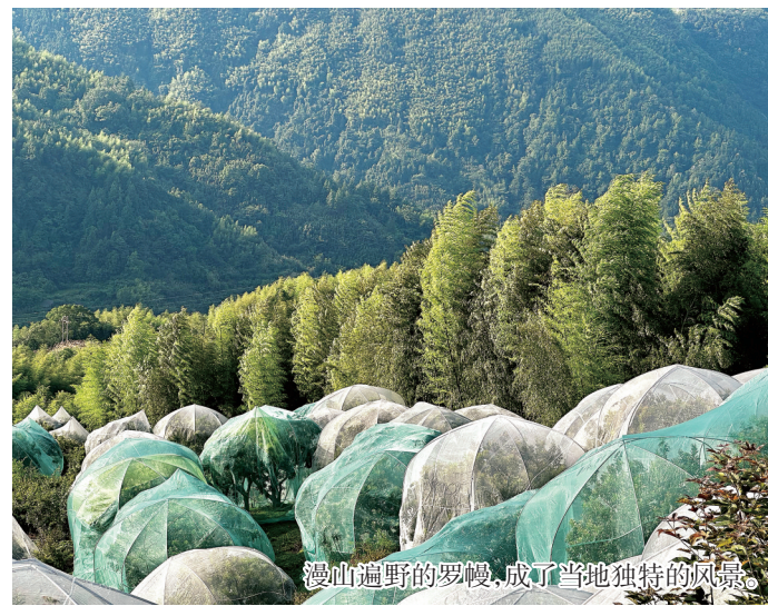
漫山遍野的罗幔,成了当地独特的风景