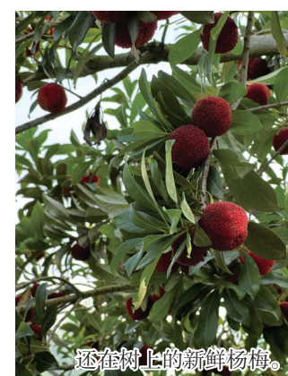
还在树上的新鲜杨梅

闷热沉闷的天气,需要杨梅来拯救。从树上摘下一颗杨梅放嘴里,每一缕果肉的纤维中都充盈着丰沛的汁水,咬下一口,就好像在嘴里放了一场小型烟花,甜与酸交织的味道,瞬间唤醒了人们的味蕾,梅雨季的闷热潮湿也仿佛一扫而空,此刻在你身边,只有山风吹拂。