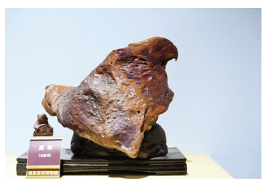
博物馆内收藏的各种质地、纹理、造型的石头。