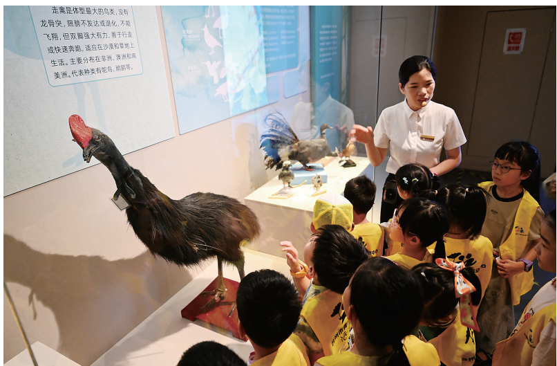
学生团队参观博物馆展览。

可是,灵动的鸟儿跳动在台州的山水湿地之间,普通市民即使有心观鸟,也鲜有近距离观察它们的机会。