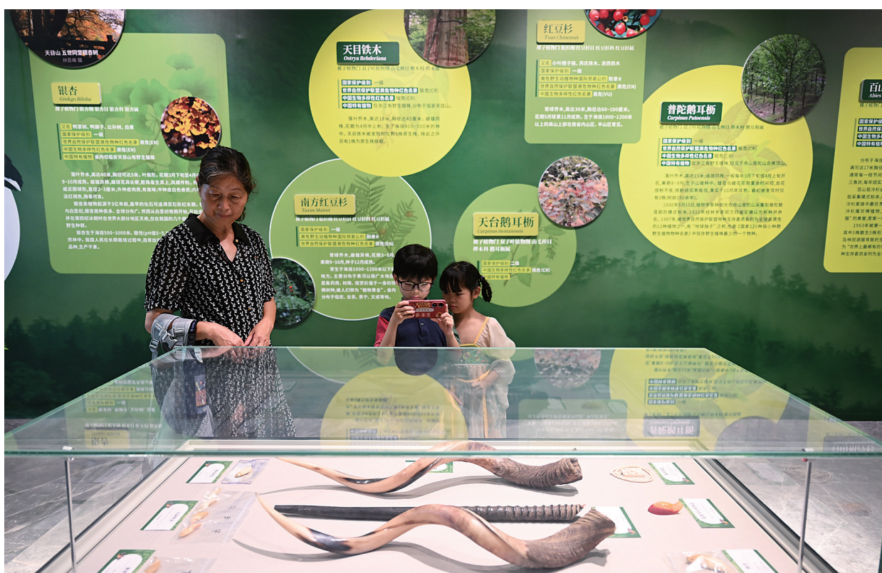
浙江珍稀濒危野生动植物保护专题展展示了多个珍贵物种标本。

充分了解展览内容后,搭建出“山、海、鸟、乐”四个乐章,其中有《布谷鸟》《我是一只小小鸟》等与飞鸟有关的歌曲,也有其他动听的和山海美景有关的曲子,这是一个专门为特展量身打造的精品音乐会。博物馆的艺术教育、美术教育居多,音乐教育较少。然而,音乐教育对孩子的情绪价值有更直接的作用,用音乐会作为配展活动,让青少年观众们在观展之余,能用欣赏音乐的方式沉浸在飞鸟世界中,同时也为爱乐合唱团的孩子们提供了一次特别的锻炼机会,有意思,更有意境。”台博宣教部主任项超英说。