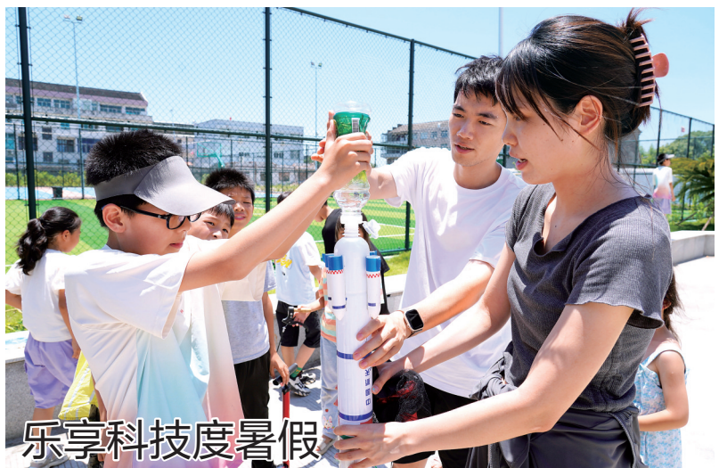
7月18日,在温岭市滨海镇全民健身中心,孩子们在大学生志愿者的指导下制作“水火箭”。当日,滨海镇团委、党建办联合宁波财经学院开展“乐享科技魅力”主题科普活动,丰富孩子们的暑假生活。

大海科技酝酿大突破。今年我市聚焦海洋优势领域和重大创新资源,不断提升海洋科创平台能级,目前全市培育海洋领域国家高新技术