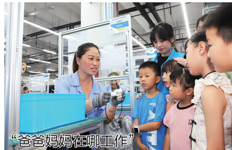
7月18日,路桥区螺洋街道总工会组织联合吉利豪达汽车电器有限公司开展“职工子女进车间”活动,小朋友们走进企业车间看生产,了解爸爸妈妈的工作环境,该公司党支部党员还为小朋友们送上了学习用品和玩具。