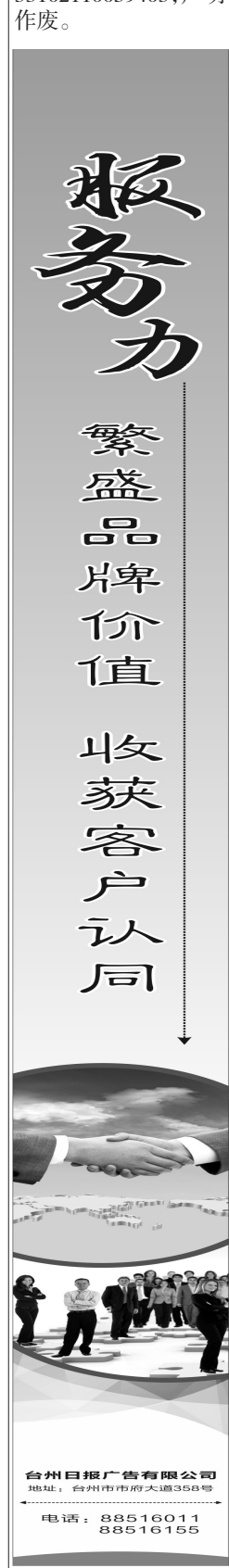
台州日报广告有限公司 地址:台州市市府大道3338号 电话:88516011 88516155