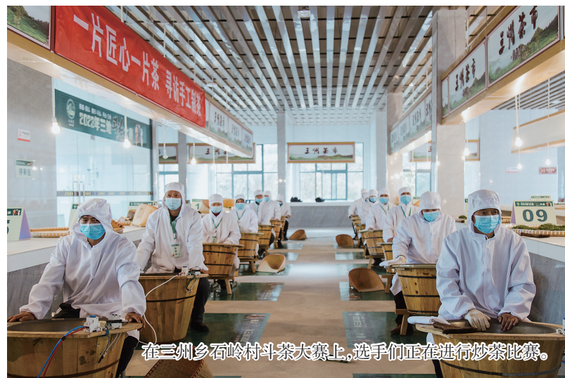
在三州乡东坑村斗茶大赛上,选手们正在进行炒茶比赛。

据了解,今年是路桥、天台两地实施山海协作工程的第21年。两地越走越近,越走越亲,建立了产业协同发展机制,探索出了一条优势互补、互利共赢的新路子。