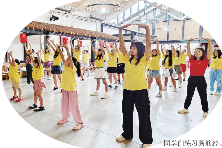
同学们练习易筋经。