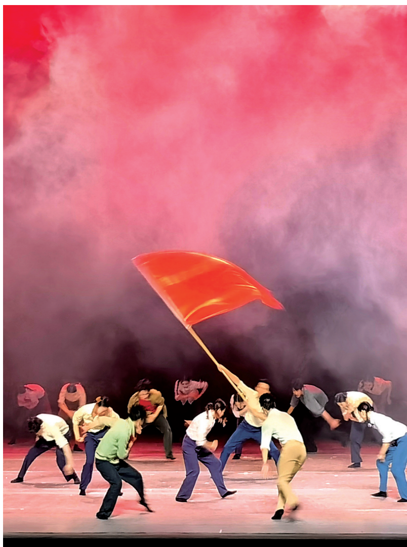
在演员轻盈的舞步中,剧情进入了高潮。