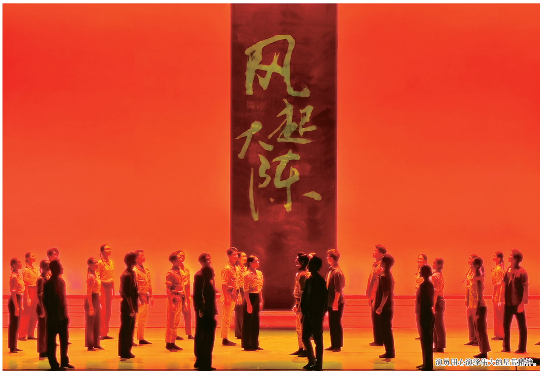
演员用心演绎伟大的垦荒精神。