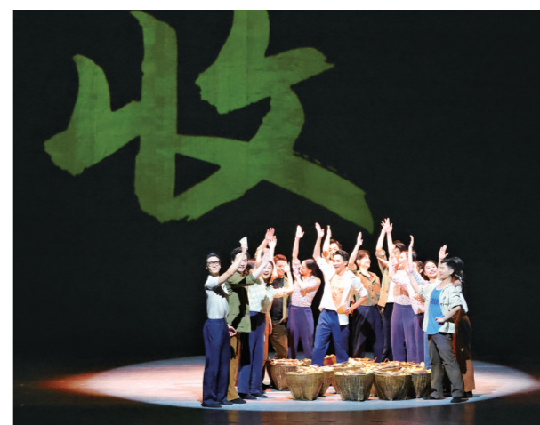
演员将丰收后喜悦的心情演绎得淋漓尽致。