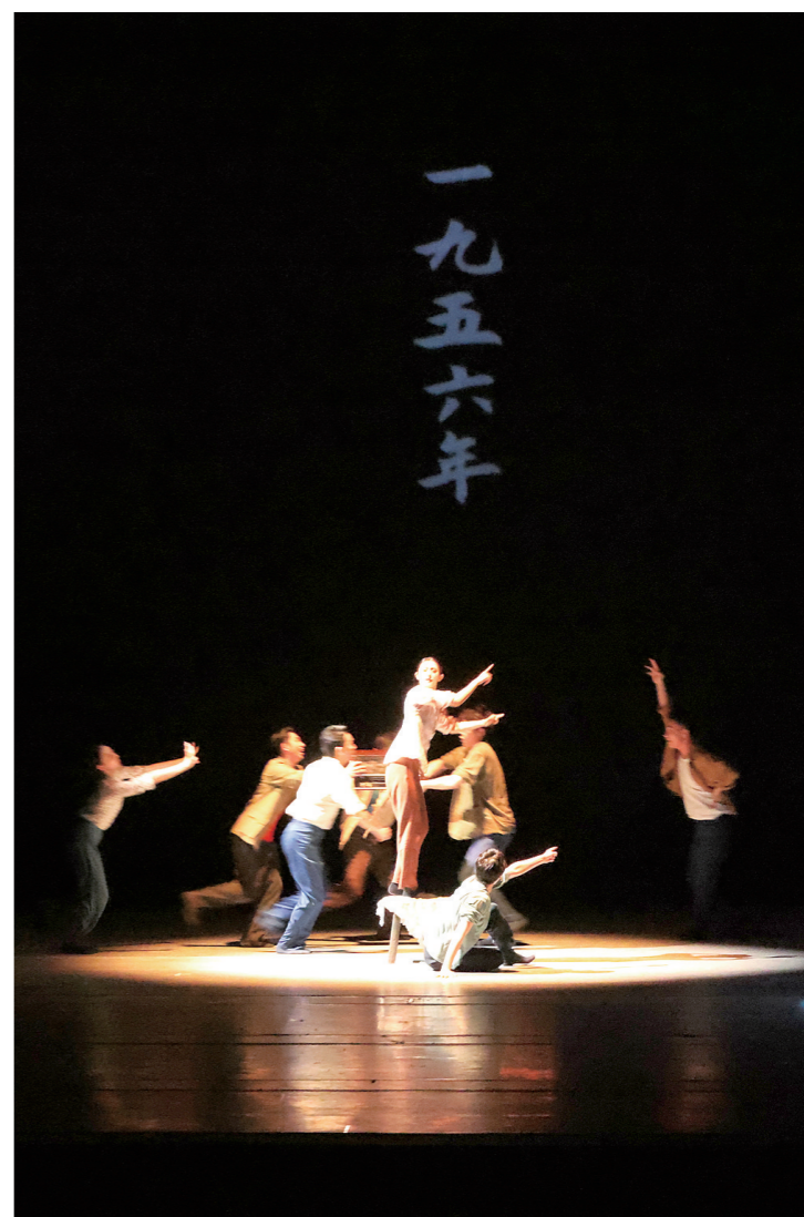
故事开始于1956年,首批青年垦荒队员登上大陈岛。