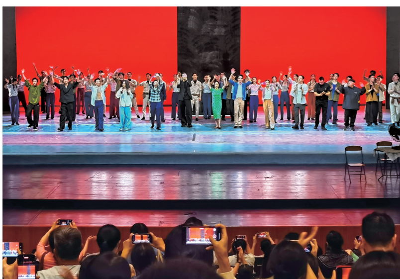
演员谢幕,国家大剧院里掌声如潮。