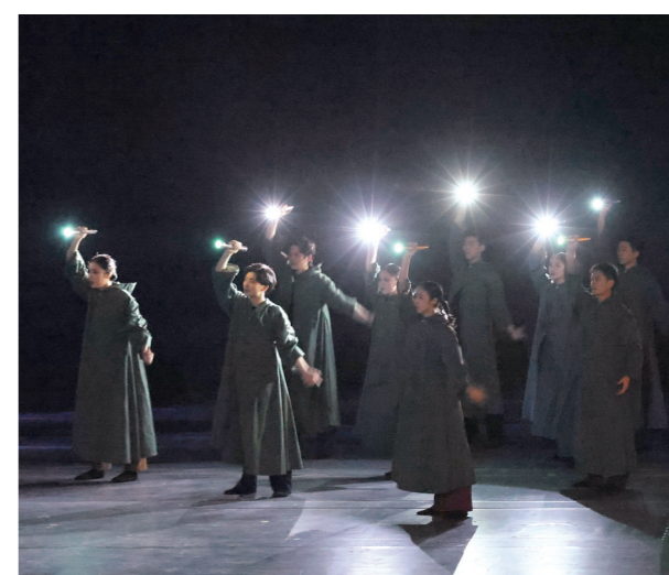
演员用手中的手电筒将微弱的光汇聚。