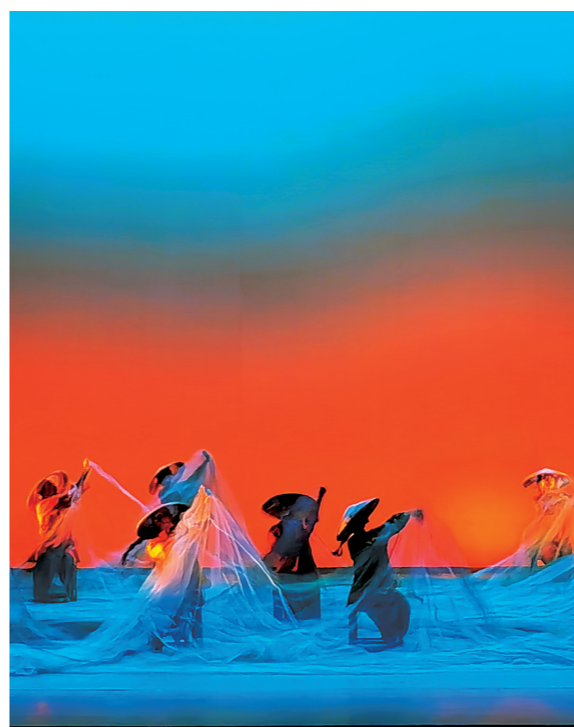
编织渔网,寓意编织美好的生活。

7日晚,我在国家大剧院,举起了相机,将镜头聚焦舞台,试图定格住舞者曼妙的身姿,记录《风起大陈》的美好,也试图让故事以另一种方式呈现。