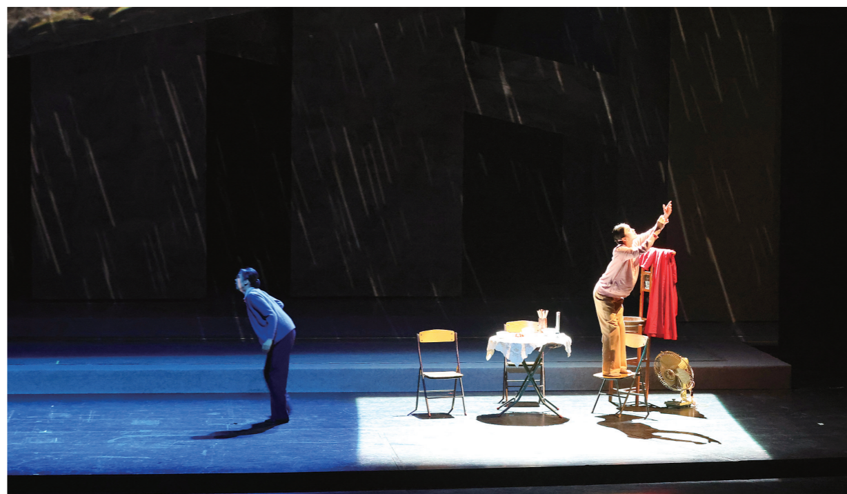
通过“风”“雨”“灯”等元素在舞台上的呈现,舞剧极具浪漫主义色彩。