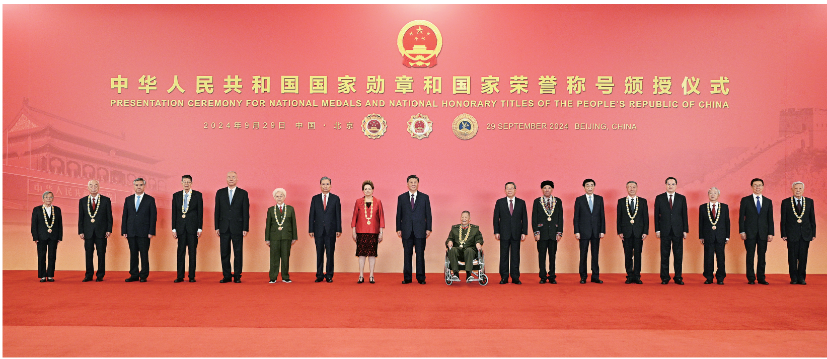
9月29日,中华人民共和国国家勋章和国家荣誉称号颁授仪式在北京人民大会堂金色大厅隆重举行。习近平等领导同志同国家勋章和国家荣誉称号获得者合影留念。

新华社北京9月29日电 中华人民共和国国家勋章和国家荣誉称号颁授仪式29日上午在北京人民大会堂金色大厅隆重举行。中共中央总书记、国家主席、中央军委主席习近平向国家勋章和国家荣誉称号获得者颁授勋章奖章并发表重要讲话。习近平强调,伟大时代呼唤英雄,造就英雄。英雄辈出,党和人民事业就会兴旺发达、长盛不衰。各级党委和政府要关心关爱英雄模范,推动全社会尊崇英雄、学习英雄、争做英雄。希望受到表彰的同志珍惜荣誉,再接再厉,争取更大荣光。 李强、赵乐际、王沪宁、丁薛祥、李希、韩正出席颁授仪式,蔡奇主持。 9时许,国家勋章和国家荣誉称号获得者集体乘坐礼宾车从驻地出发,由礼宾摩托车队护卫前往人民大会堂。人民大会堂东门外,礼宾分列道路两侧,青少年热情欢呼致敬。国家勋章和国家荣誉称号获得者沿着红毯拾级而上,进入人民大会堂。党和国家功