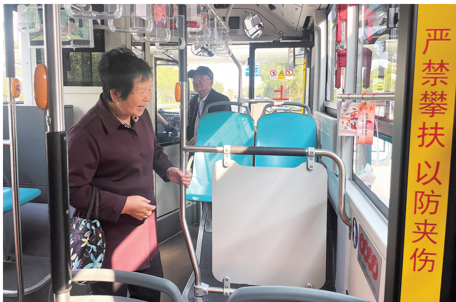
图为老人乘坐101路“敬老爱老”公交专线。

此外,从2016年起,台州公交就开始购置配备无障碍公交车,让乘坐轮椅的乘客不用为上下车而发愁。“目前全市共配备