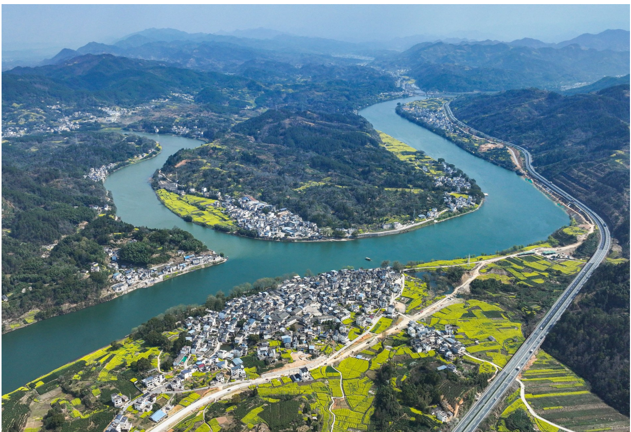
这是2024年3月22日在安徽省黄山市歙县拍摄的新安江山水画廊风景(无人机照片)。