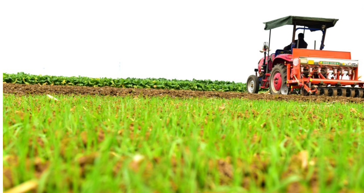
10月27日,农机手驾驶小麦播种机在山东省枣庄市山亭区城头镇清河崖村田间作业。