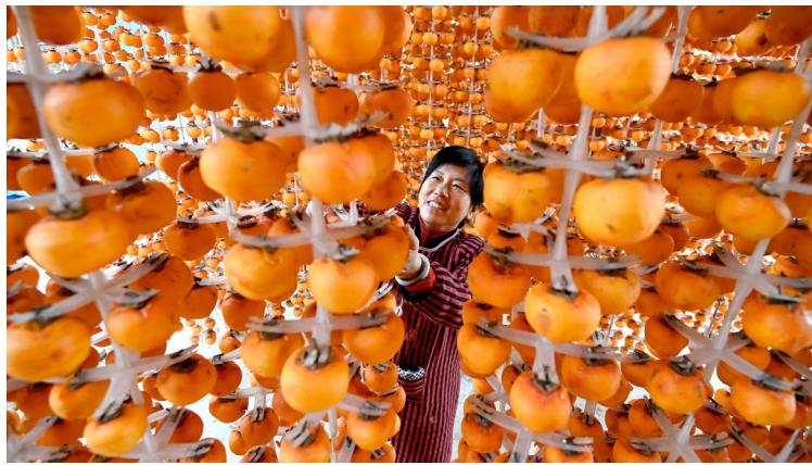
10月28日,河北省邯郸市磁县北贾壁乡北贾壁村的农民在吊晒柿子。