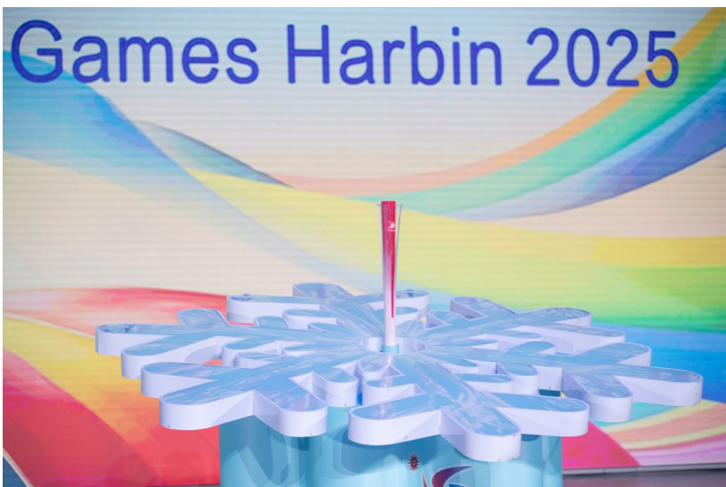
这是10月30日在活动现场拍摄的亚冬会火炬。本届亚冬会火炬主题为“澎湃”,寓意着本届亚冬会将充满活力与激情。

10月30日,第九届亚洲冬季运动会倒计时100天主题活动在哈尔滨冰球馆举行。活动现场发布了本届亚冬会奖牌和火炬,并播放了本届亚冬会会歌。