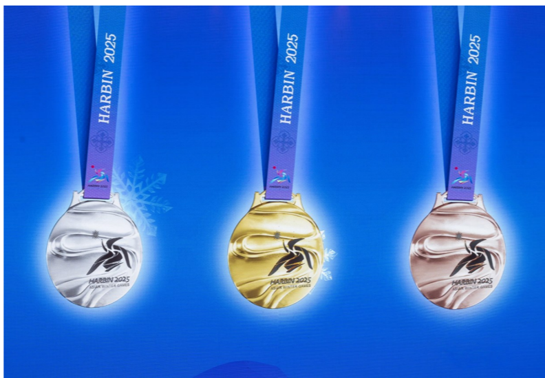
10月30日,活动现场大屏幕显示亚冬会奖牌“竞速精神”的正面。