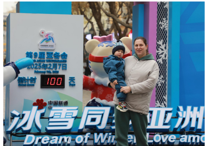
▲在哈尔滨市中央大街上,人们与亚冬会吉祥物雕塑合影(10月29日摄)。10月30日是2025年第九届亚洲冬季运动会倒计时100天。赛会将于2025年2月7日开幕。