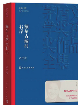
1247/57/312 普通文献借阅室 台州市图书馆

无独有偶,跨年演讲不久后,马未都出版了《背影》。这本散文集属于悼文集,里面是马未都对25位亲人好友的深情回忆和无限哀思。读这样的书,自然百感丛生,其中有酸、有痛、有哭、有莫名的惆怅……最后一切皆成空,付于相思中。无论古时,还是近现代,悼念亡故