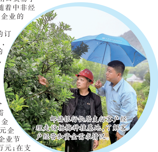
邮储银行客户经理走进田间地头,了解客户经营和资金需求情况。

增加了土地承包经营权、村集体组织股权、农险保单、理财产品、养殖活体抵押等要素的评估,并将道德、诚信、家风等因素作为加分项。“硬资产+软资产”都可以纳入“农户家庭资产池”,全面盘活农户沉睡资产,全面促进普惠金融惠及千家万户。