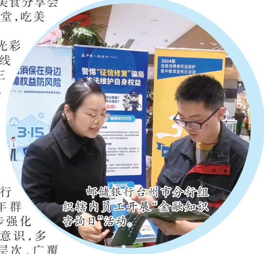
邮储银行台州市分行组织辖内员工开展“金融知识容目”活动。

验。同时,针对因身体等原因无法亲自到办业务的老年群体,该行打破网点空间限制,特事特办,提供上门服务。