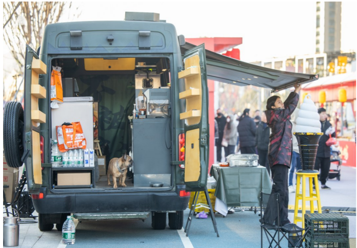
小狗也陪着主人出来摆摊。