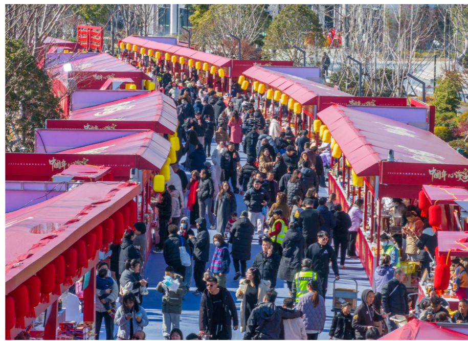
进入假期,开启“人从众”模式。