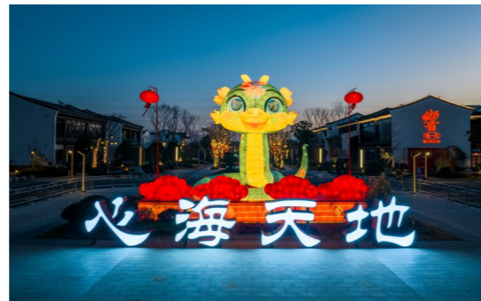
春节去哪?心海天地欢迎你。