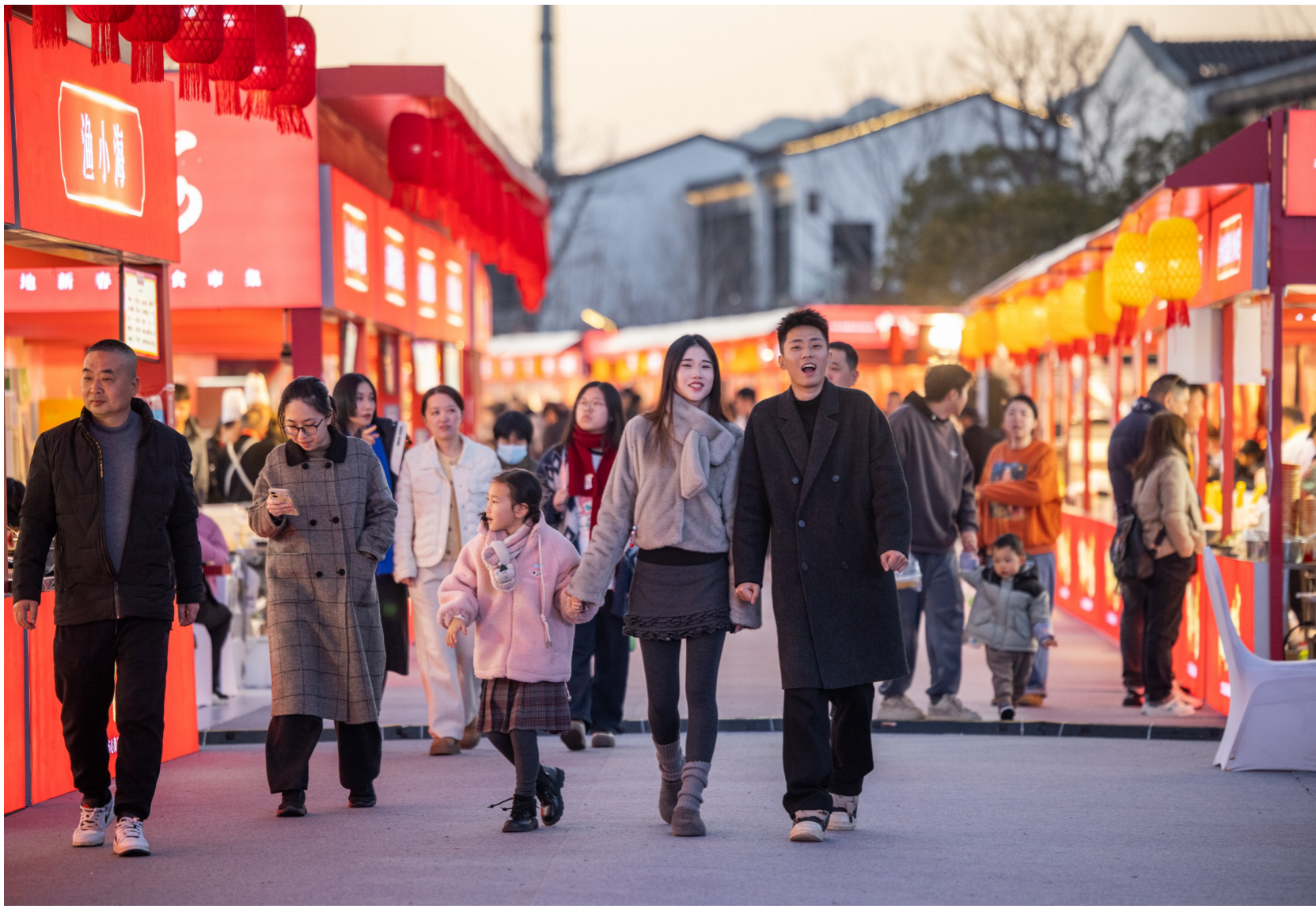
心海天地吸引了不少年轻市民来逛。