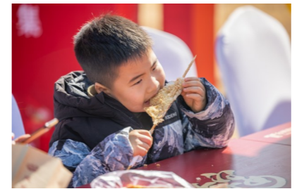
赶紧来大快朵颐吧!