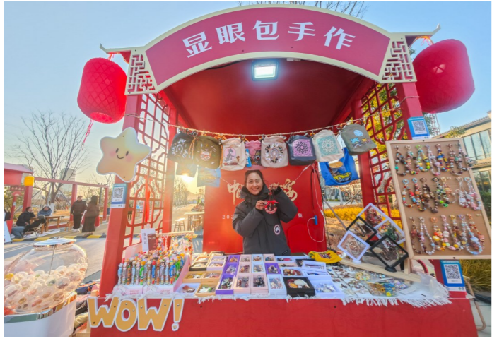
好吃的美食不少,好看的手工也不少。