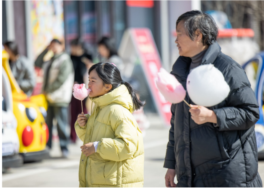
一口软甜的棉花糖,满满童年的味道。