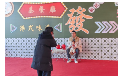
港式风味吸引市民来打卡。