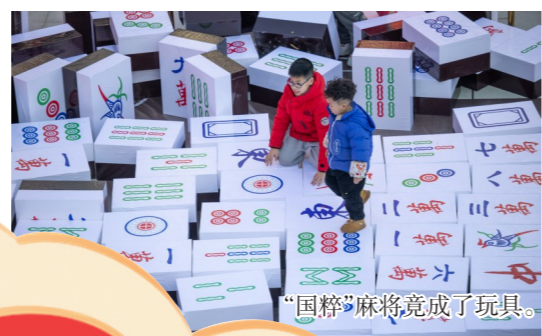
“国粹”麻将竟成了玩具。