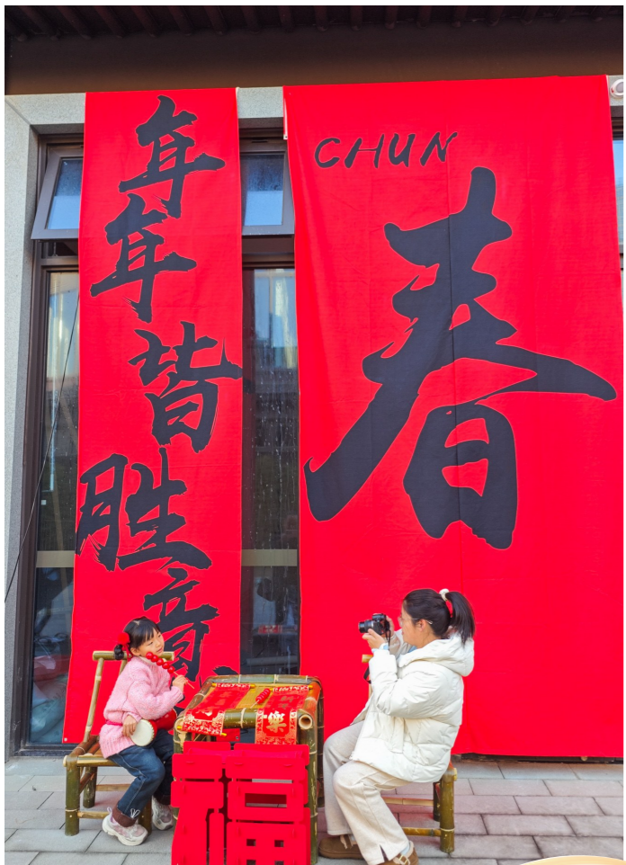
到处都是新春元素。