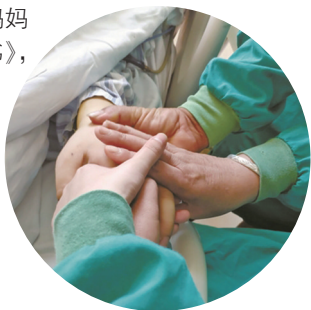
一家人「最后的合影」。 做出捐献器官决定后,

儿子 很遗憾 爸妈照顾不到你了 以后天冷要记得加衣 天热要记得换衣 按时吃饭 不能饿着自己 钱不够花的时候记得托梦给妈妈 儿子 当你走到生命尽头 妈妈和爸爸一起做了一个痛苦的决定 把你的器官捐献给有需要的人 我们在失去你时已经非常痛苦了 不想别的五个家庭面临家破人亡 也不知道儿子你怨不怨我们 我们其实是想让你有另外一种活法 但是我们还是很亏欠你 很多人说 母子之间是有心灵感应的 妈妈想告诉你 妈妈爸爸一直很爱你 妈妈希望下辈子 你能陪着我们 陪我们到白头 (有删减)