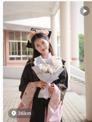
拍摄vlog | 更适合中国宝宝的毕业照 抓...