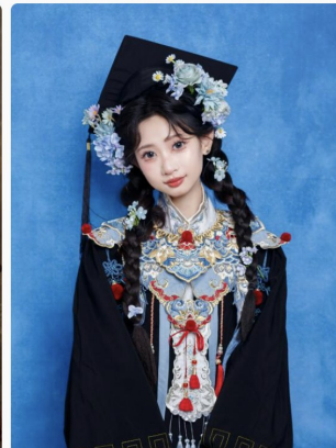
在台州!也拍到了国风毕业照! 汉服与学士服...