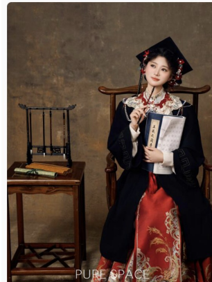
台州国风毕业照 | 独属于中国学生的写真 国风学...