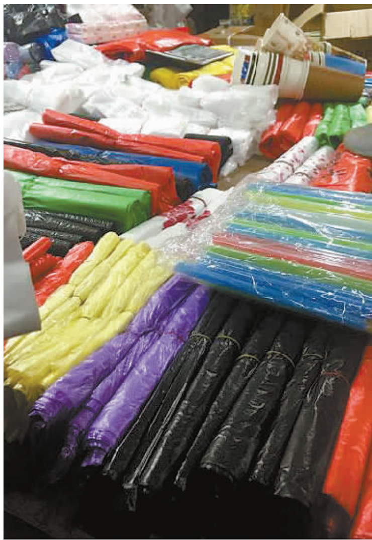
菜市场里用于装食品的塑料袋应该是本色的透明的,但目前市场里大部分塑料袋都还是有颜色的,红的、绿的、蓝的、黑的……这些都是不符合规定的,甚至很多是不合格产品。

我们不怕查,也没有人来查过。我们的设备很容易转移,来查也不一定查得到。”他说,他们可以打“游击战”,晚上生产、白天歇工只是其中一种方式。