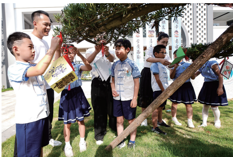
小小贺卡 传递感恩

点部署的11方面重大改革任务,对标对表、谋实举措细抓细管,推动全市各地各单位切实扛起改革责任。要推动工作提质增效,扎实推进纪检监察体制改革,进一步在完善“四项监督”统筹协调、强化各类监督贯通协同、加快数字技术融合应用上下功夫,不断实现监督检查模式重塑、效能跃升,努力形成一批具有台州辨识度的纪检监察改革成果。 市委组织部面向机关全体干部,传达学习贯彻会议精神。会议强调,要在学深悟透上先行示范,把学习贯彻市委六届六次全体(扩大)会议精神与学习贯彻党的二十大精神、省委十五届五次全会精神贯通起来,准确把握进一步全面深化改革的核心要义、奋斗目标和重大举措,迅速在全市基层党组织和广大党员干部队伍中掀起学习热潮,进一步凝聚思想共识、汇聚各方合力;要在对标谋划上先行示范,找准党的制度建设改革切入点和着力点,勇于打破惯性思维,敢于较真碰硬,努力探索打造组织系统进一步全面深化改革的