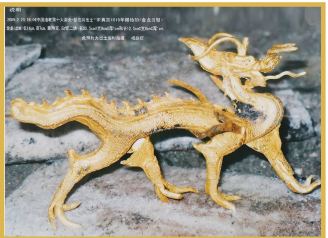
公元1018年,宋真宗所赐的“金龙白璧”