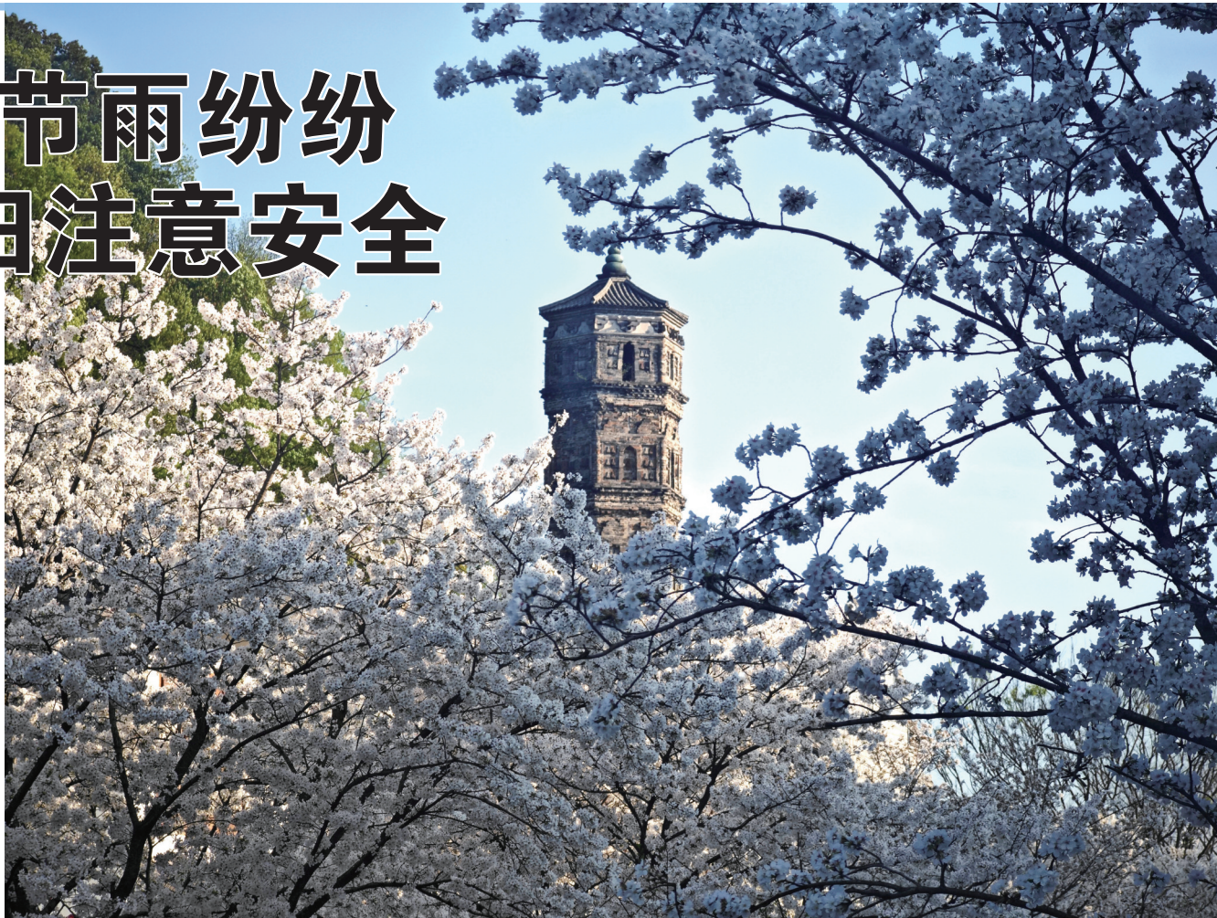
临海台州府城樱花盛开,引来众多游客拍照打卡。